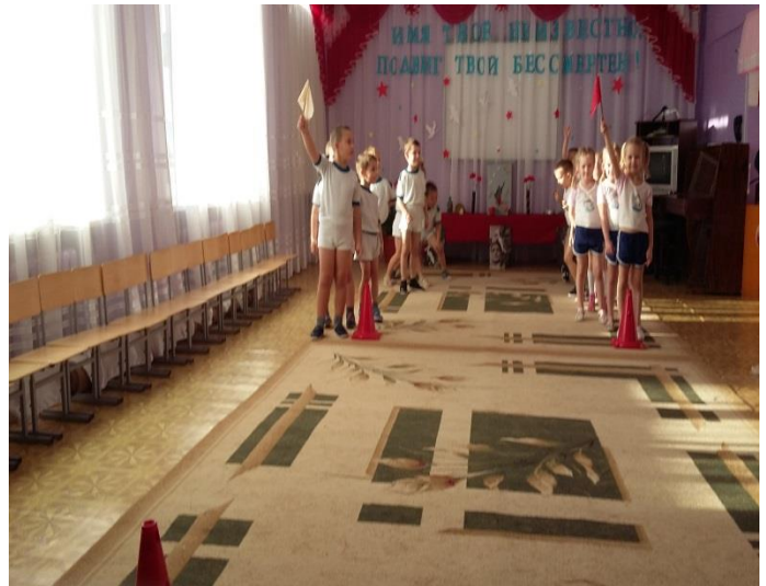
Эстафета «Перенеси снаряды»