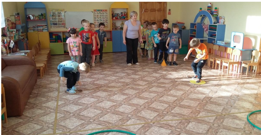
Игра «Боевая тревога»