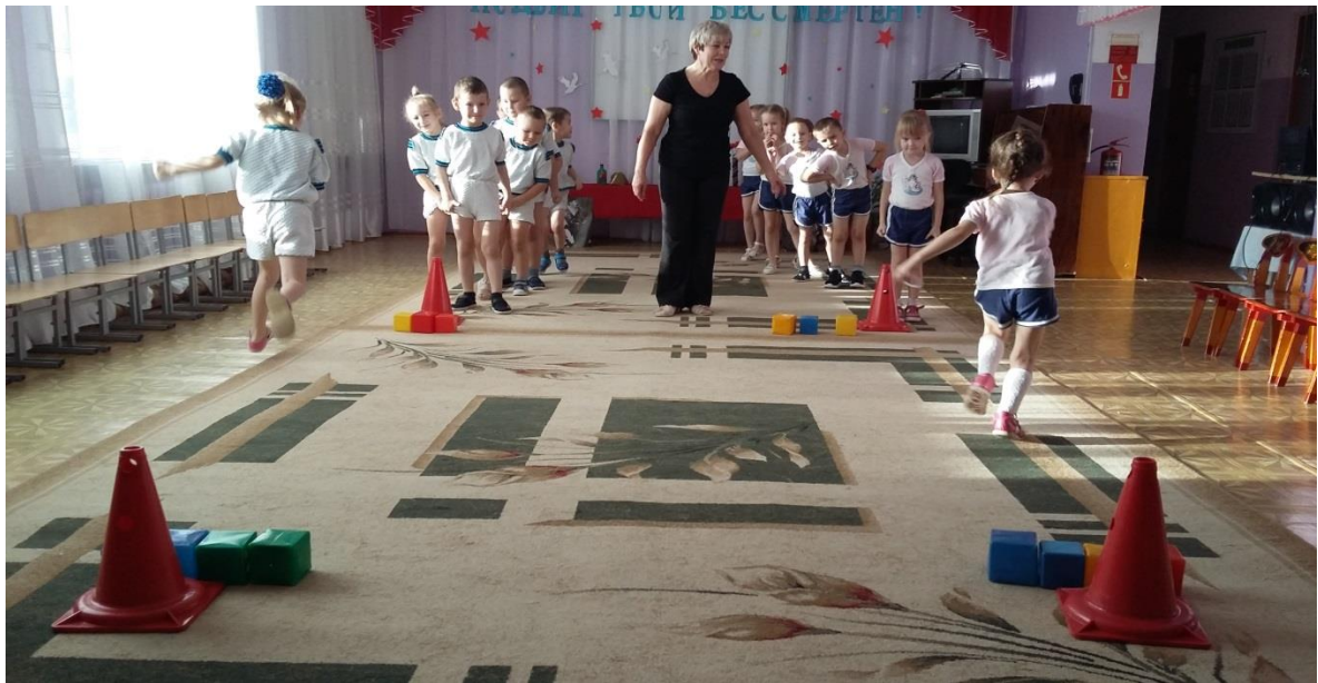
Эстафета «Донеси флаг»