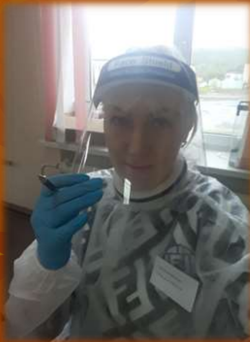
Председатель УИК № 104