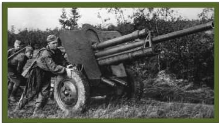
Исты – исты – исты – отважные ... (артиллеристы)