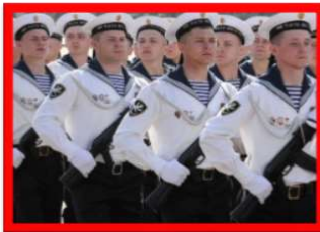
Ки – ки – ки – воюют наши ... (моряки)