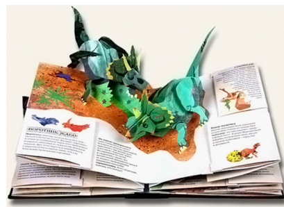
Рисунок 11. Книжки с картонными объемными иллюстрациями