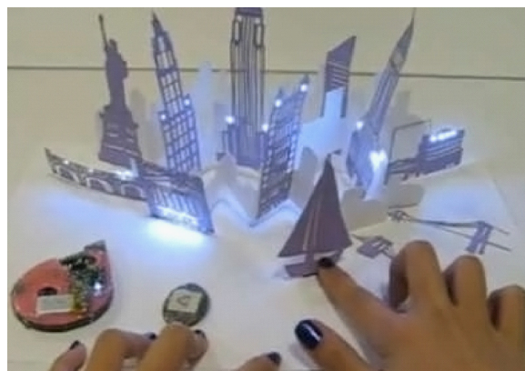
Рисунок 12. Сенсорная книга «будущего»

Современный полиграфический комплекс книжной индустрии позволяет реализовать самые смелые идеи дизайнера. В свою очередь дизайнер книги стремиться активизировать роль ребенка-читателя в восприятии книги, сделать его соавтором своего замысла, пробудить инициативу и жажду творчества, и здесь важным компонентом является игра. Стремление к синтезу всех возможностей современного полиграфического рынка, обилие новых материалов определяет характерную черту современной