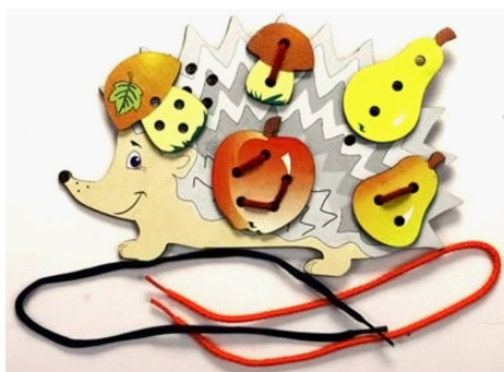
Рисунок 7. Книжки-игрушки со шнуровкой (лента, тесьма)