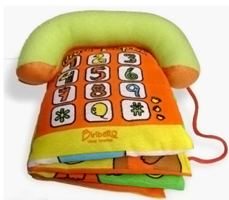
Рисунок 6. Книжка-подушка

Мягкие, плавающие и говорящие книжки-игрушки способствуют комплексному развитию ребенка, так как при производстве используются новые и современные материалы и технологии обработки. Все это дало возможность