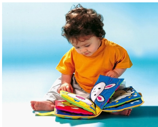
Рисунок 4. Книжки-пышки