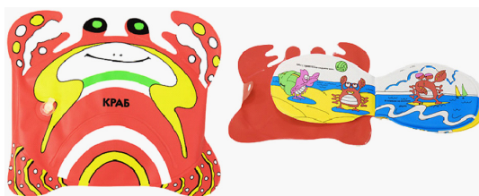
Рисунок 5. Книжки из полиэтилена для купания