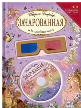
Рисунок 8. Книжки со стереоиллюстрациями