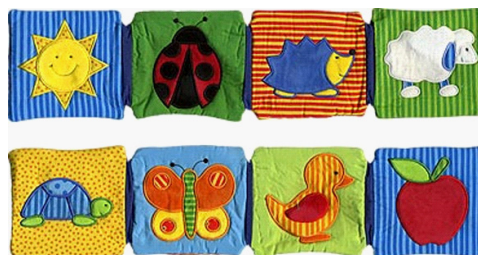
Рисунок 3. Книжки из ткани