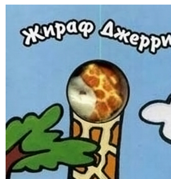
Рисунок 10. Пальчиковые книжки-игрушки (картон и ткань)