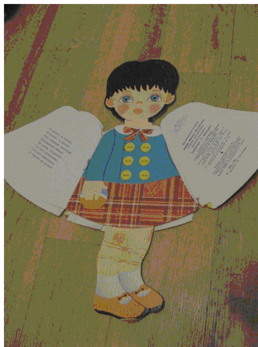
Рисунок 2. Книга «Соня в деревне», в 1916 г.

Детская книжка-игрушка – средство организации самостоятельной детской деятельности с раннего возраста. Особенности детской книги как предмета культуры имеют важное значение