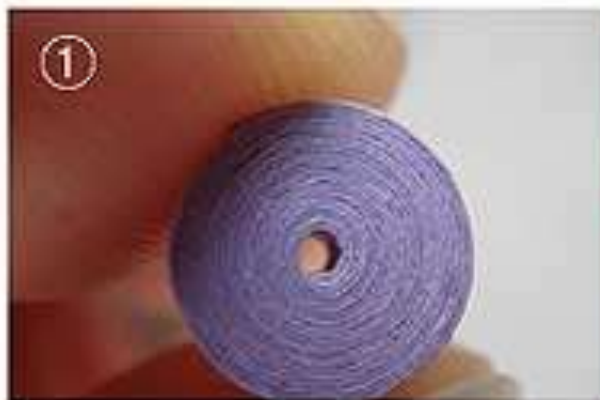
СХЕМА изготовления основной квиллинговой формы