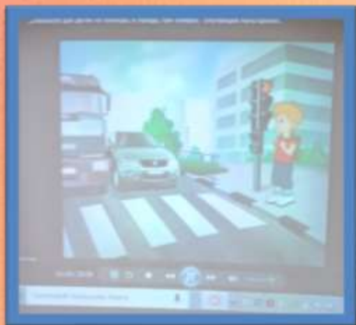
Безопасность на дороге: «Пешеход на дороге»