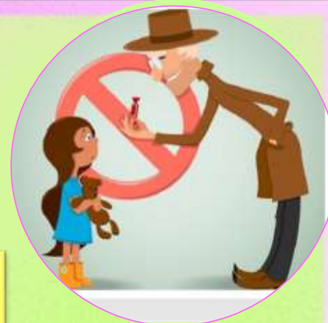
«Безопасное поведение при общении с незнакомыми людьми»

Раньше счета и письма, Рисованья, чтения. Всем ребятам нужно знать Азбуку безопасного поведения!