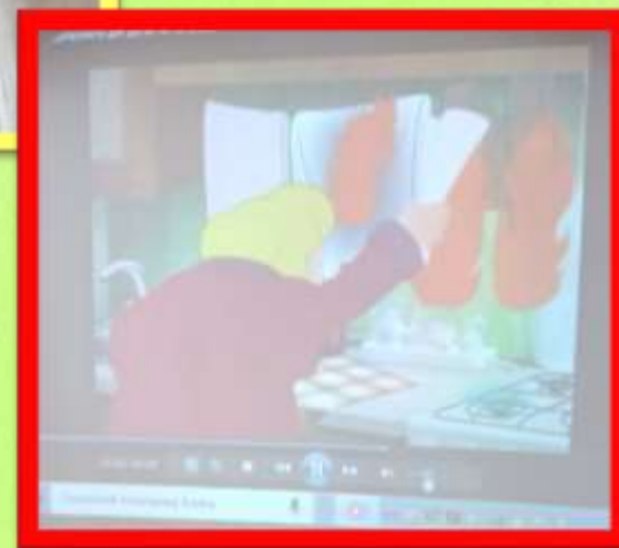
Безопасность дома: «Спички, дети, - не игрушки!»