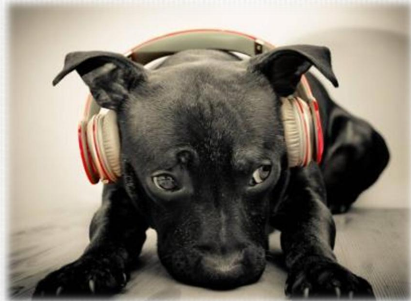
Слушаем рок-музыку музыку