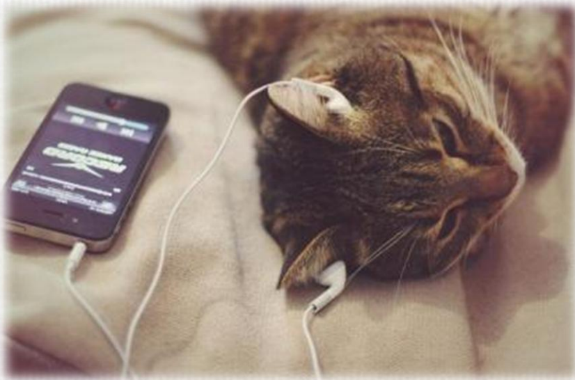
Слушаем классическую музыку

Классическая музыка положительно влияет на рост и развитие живых организмов, а рок-музыка - отрицательно.