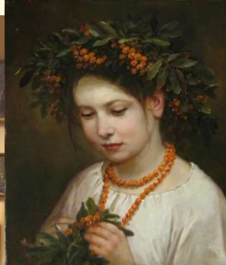
Творческая деятельность детей по замыслу «Рябиновые огни».