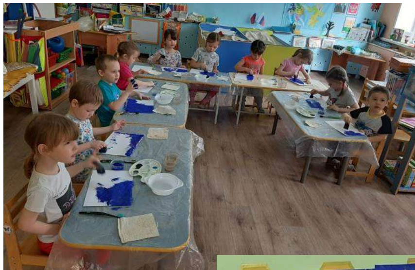
Рисунок и аппликация