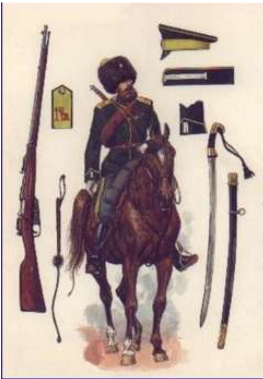
Читинский казак 1912- 1917 гг.