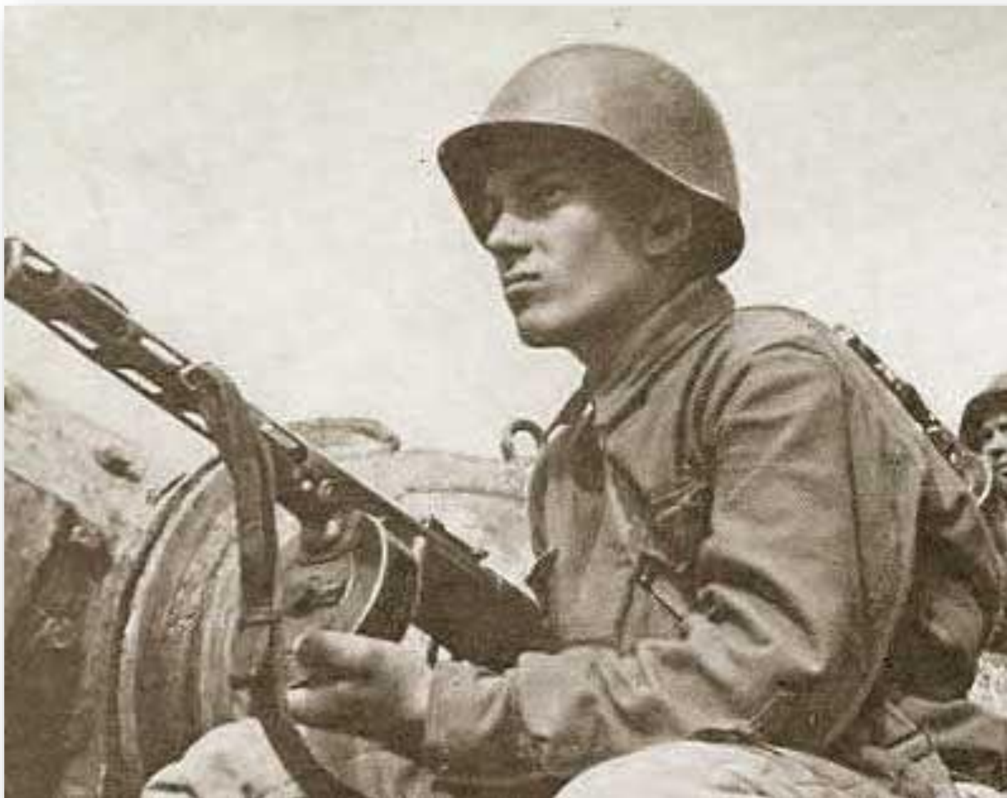
Солдатская каска Великой Победы