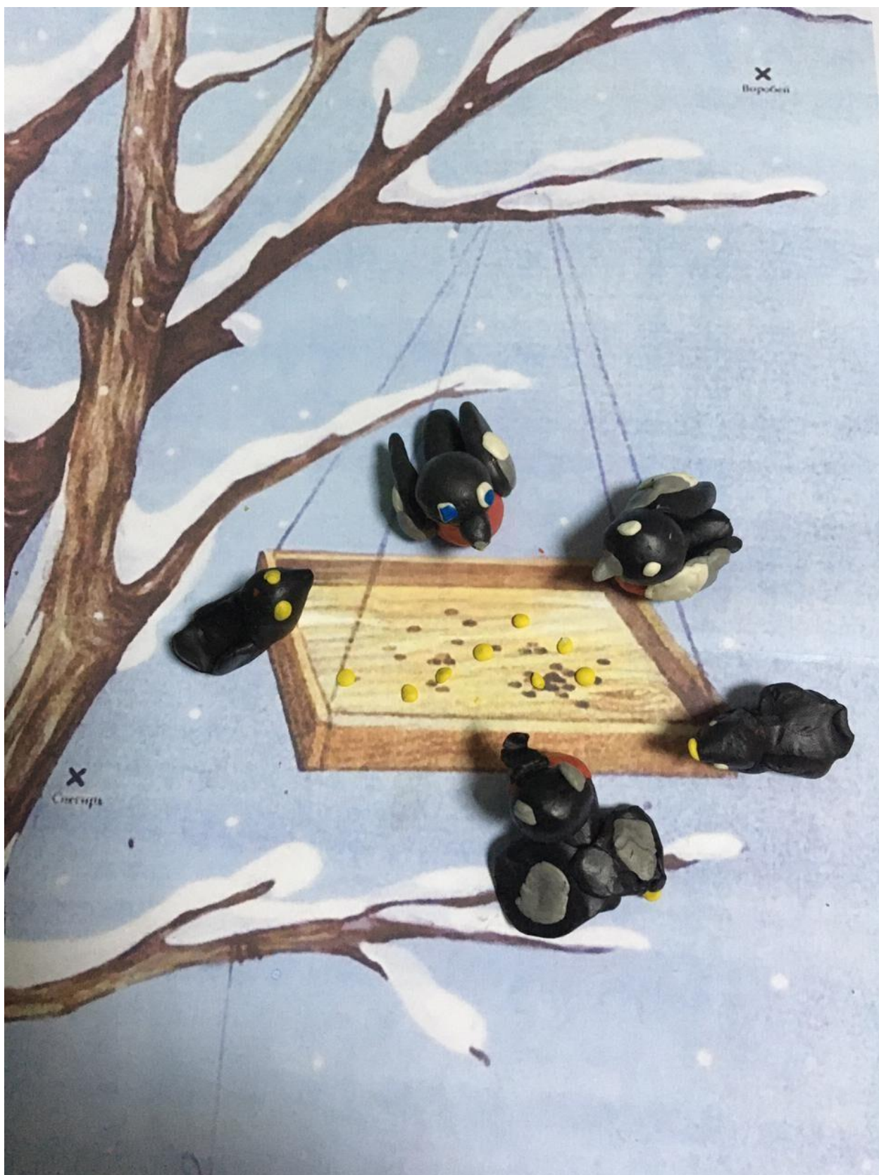
«Птицы на кормушке»