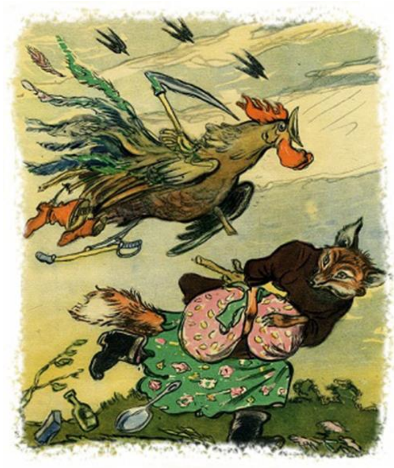
Русская народная сказка