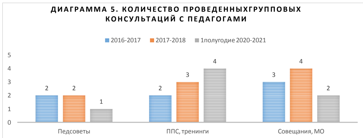
Таблица 6. Просветительская деятельность родителей и педагогов

За 2016-2017 учебный год проведено 7 групповых консультаций для педагогов. За 2017-2018 учебный год – 9 групповых консультаций. В 1 полугодии 2020-2021 учебного года проведено 2.