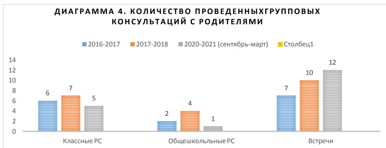
Таблица 5. Количество групповых консультаций для педагогов