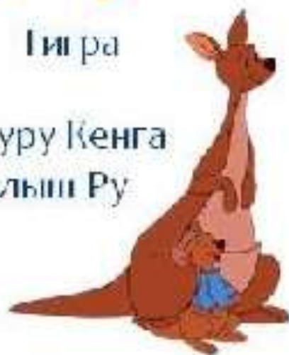
Кенгуру Кенга и малыш Ру