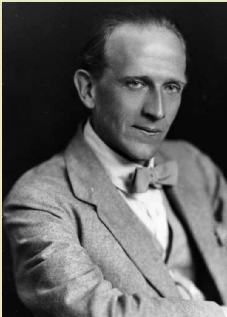
А. Милн (1882 – 1956 гг.)