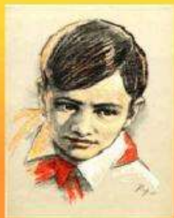
Валя Котик (партизан-разведчик)