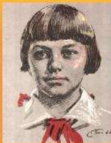
Зина Портнова (партизанка)