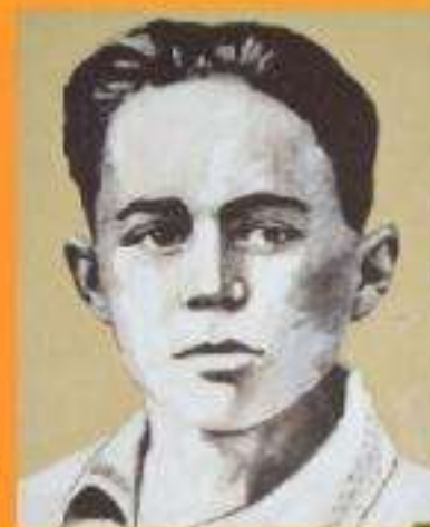
Володя Дубинин (партизан-разведчик)