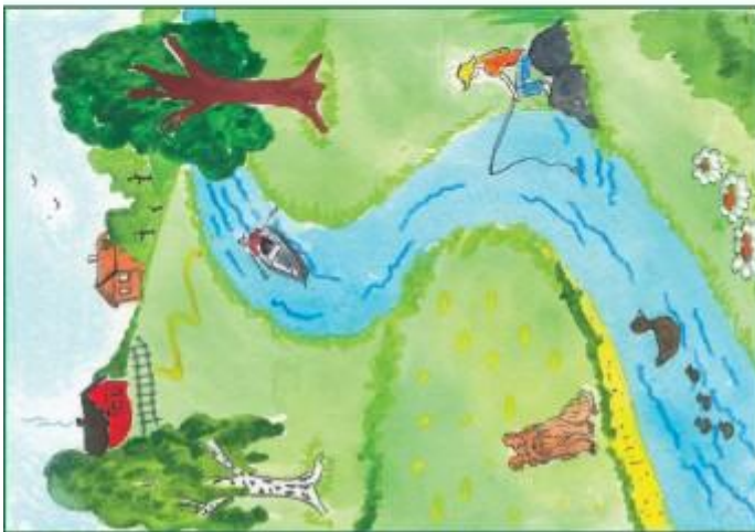
Рис. 3. Найди отличия