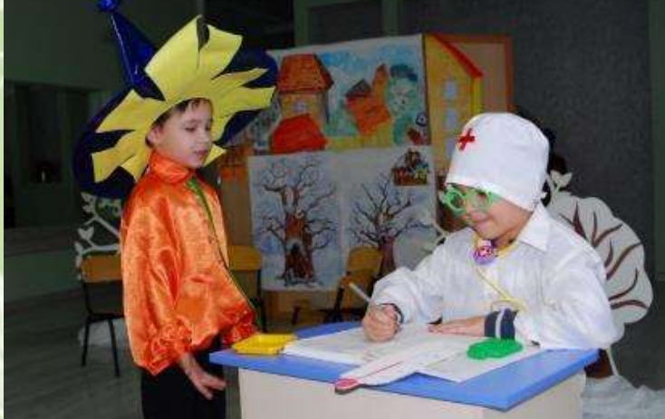
«Как Незнайка птиц изучал»

В районной газете «Грязинские известия» в 2021 году опубликована статья «В «Рябинке» снова премьера!» о работе экологического театрального кружка «ЭкоДобро» (автор Раева И.В.)