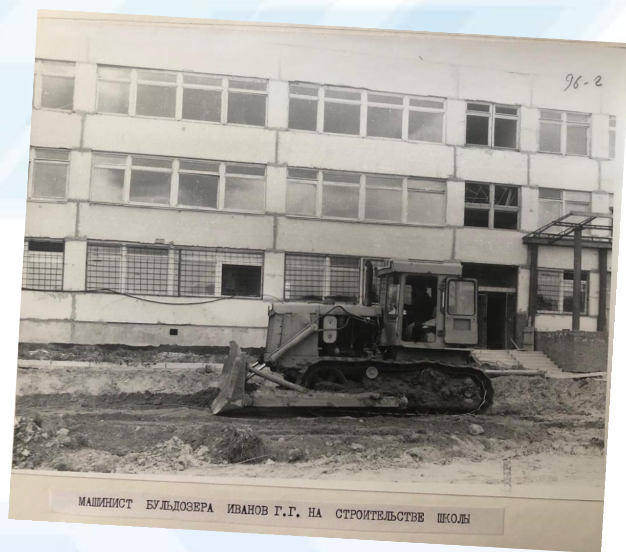
МАШИНИСТ БУЛЬДОЗЕРА ИВАНОВ Г.Г. НА СТРОИТЕЛЬСТВЕ ШКОЛЫ