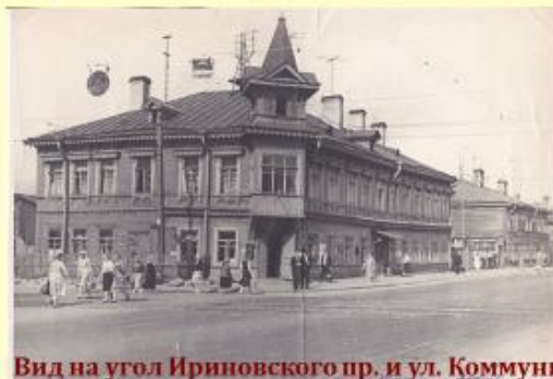
Вид на угол Ириновского пр. и ул. Коммуны