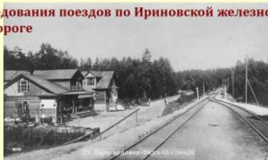
Ст. Пороховая - Вид со станции