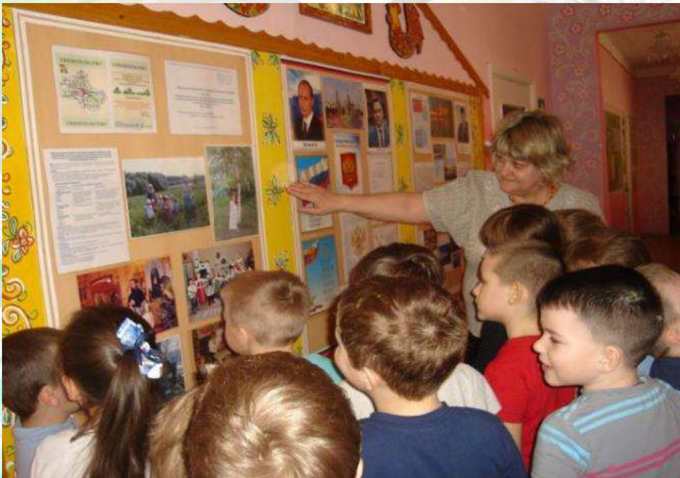
Нравственно-патриотический стенд ДОУ