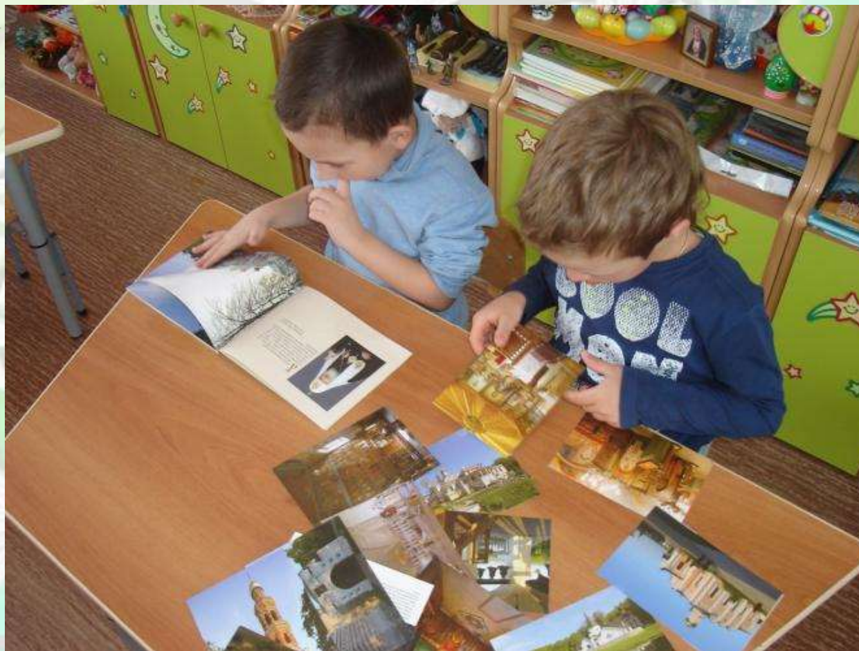
Рассматривание открыток по теме «Храмы и монастыри России»