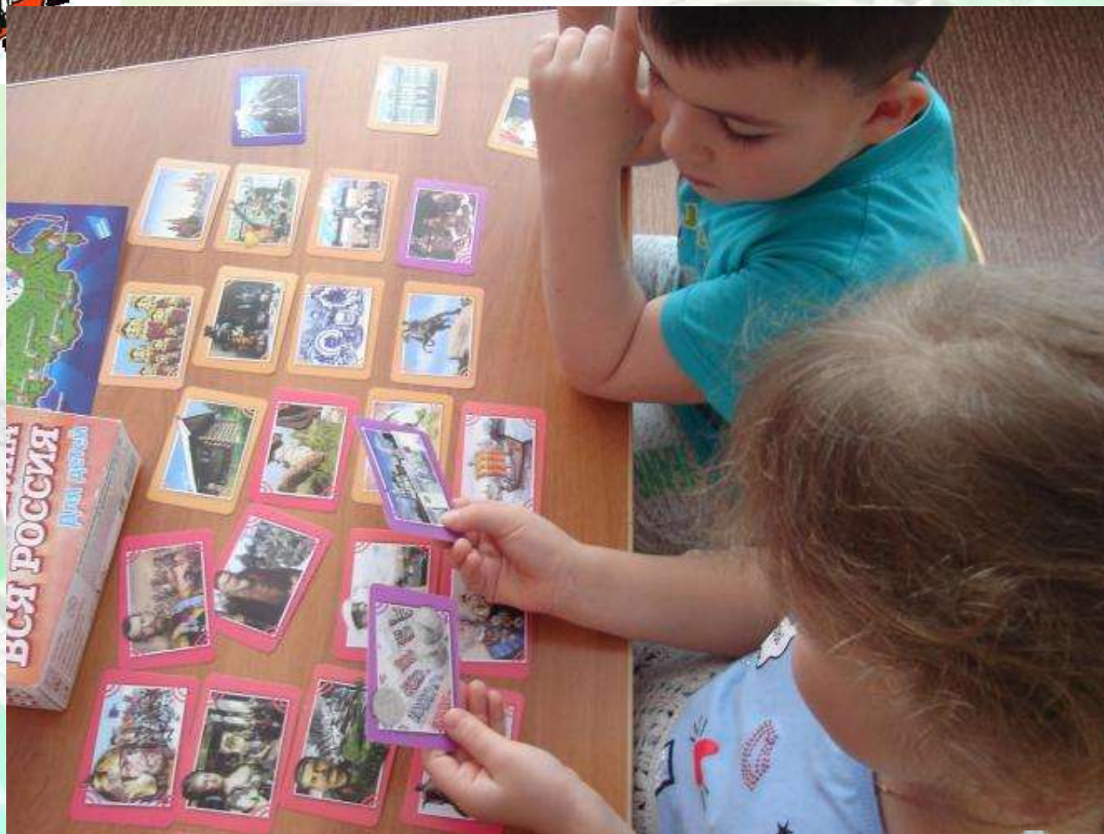
Дидактическая игра «Вся Россия»