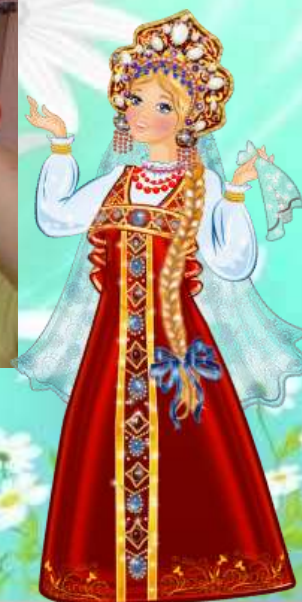
Атрибуты русского костюма