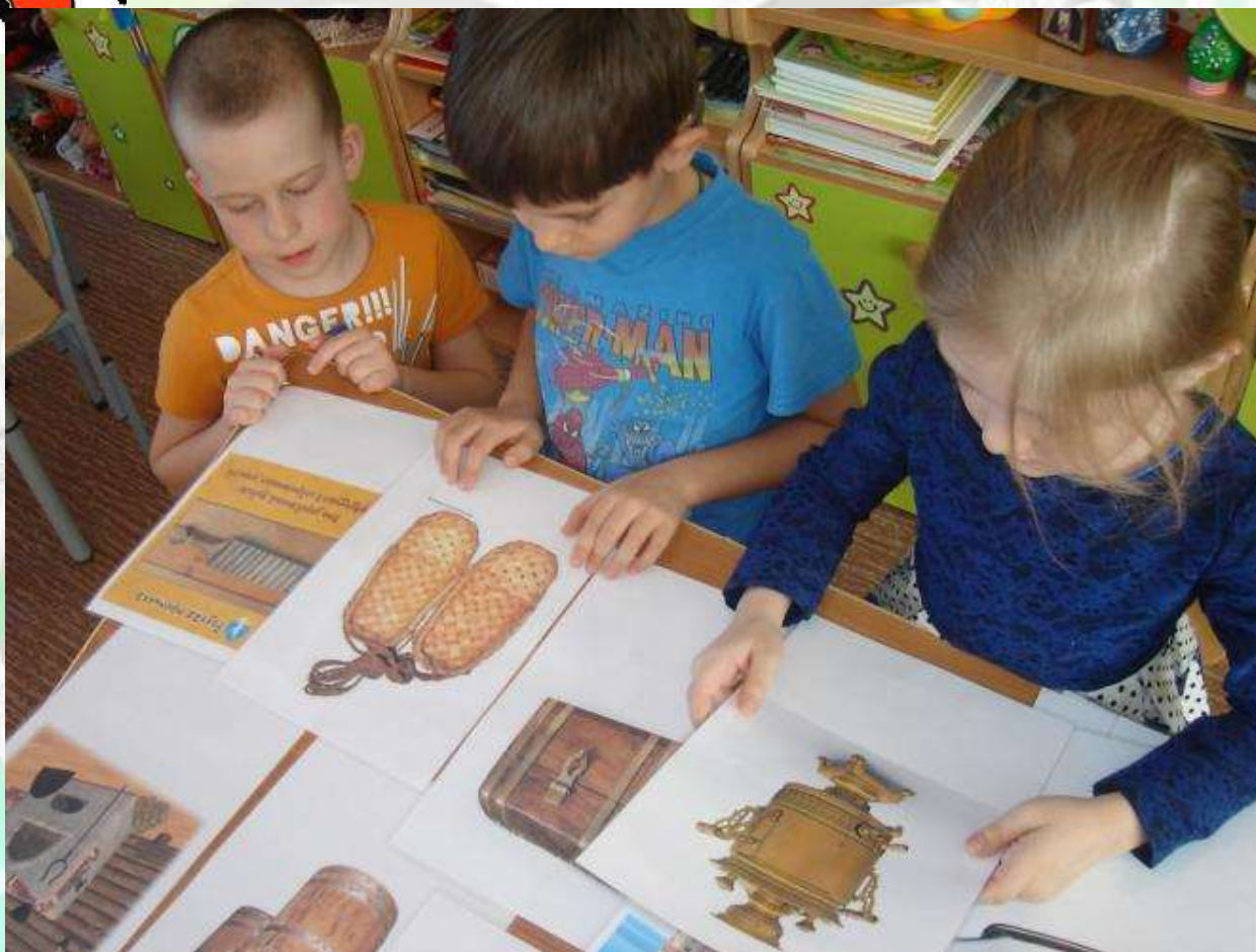
Дидактическая игра «Было – стало»