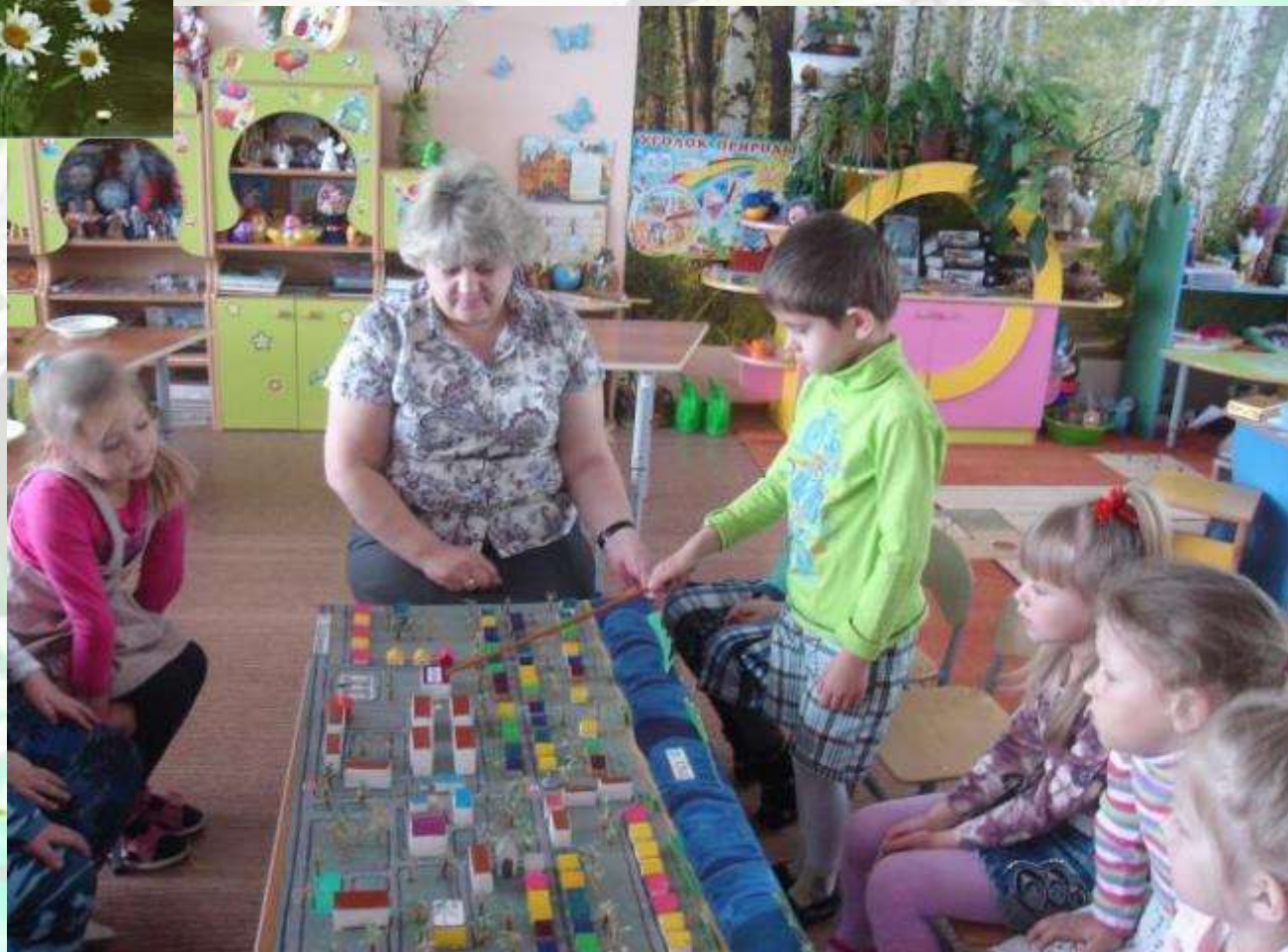
Макет села Акатъево