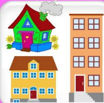
Адрес полный и описание дома