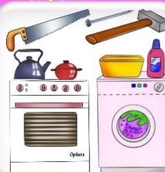
Занятия членов семьи