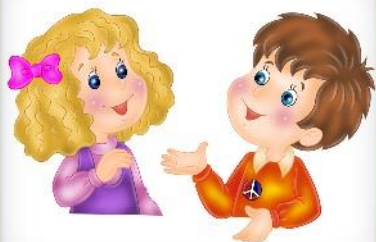
Мальчик или девочка, имя и фамилия