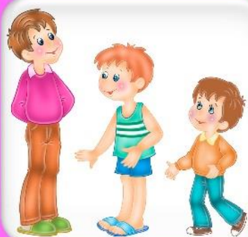
Рост (высокий, средний, маленький) и возраст