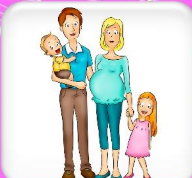
С кем я живу и за что я люблю своих близких