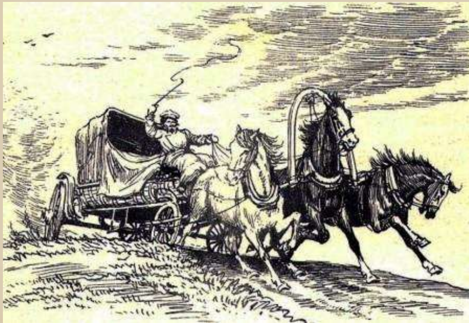
Тройка Чичикова. Художник А. Лаптев