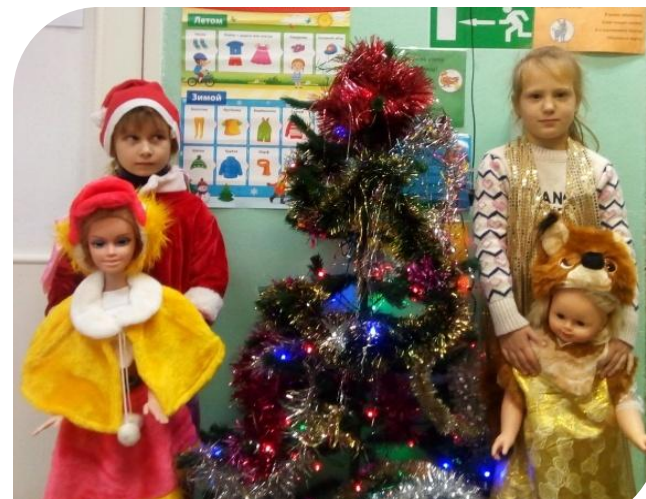
Д/И «Оденем куклу Катю на праздник»