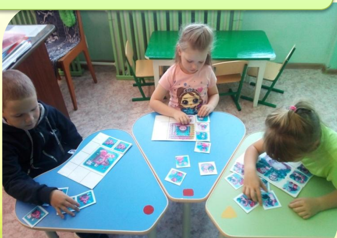
Д/И «Составь и расскажи»