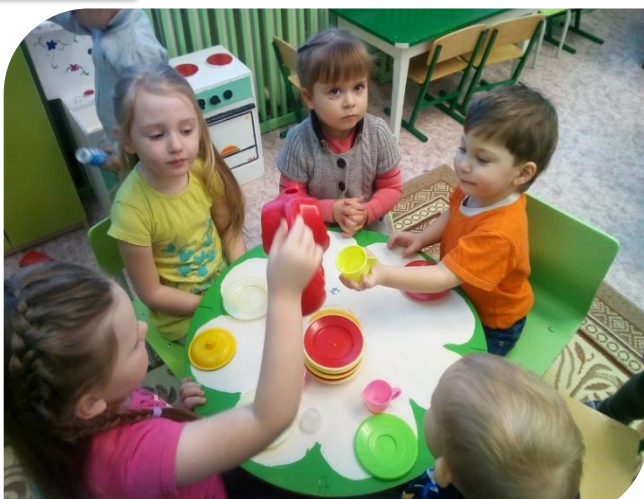
Д/И «Чаепитие с друзьями»