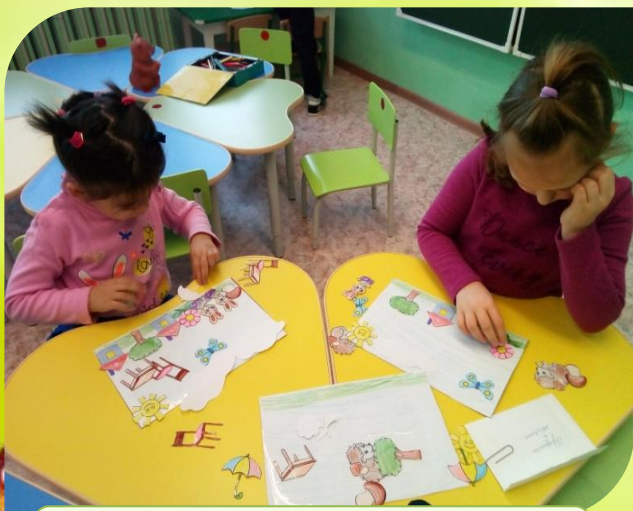
Д/И « На полянке»