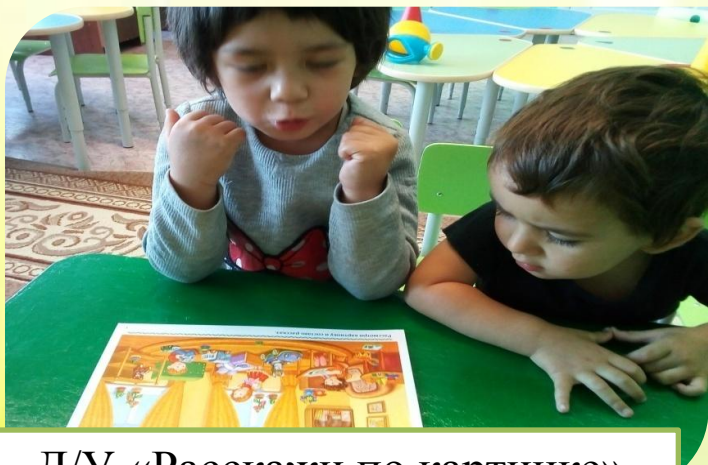
Д/У «Расскажи по картинке»