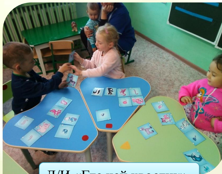
Д/И «Где чей хвостик»