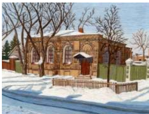
Лисовская Г.Г. г. Новочеркасск

Гладь – это вид вышивки, в котором форма рисунка покрывается плотными стежками. В народной вышивке есть очень много разновидностей глади, но все их можно разделить на две большие группы: двусторонняя гладь, в которой фон рисунка на картине покрыт стежками с лицевой и с изнаночной стороны, и односторонняя, в которой лицевая сторона вышивки сильно отличается от изнаночной.