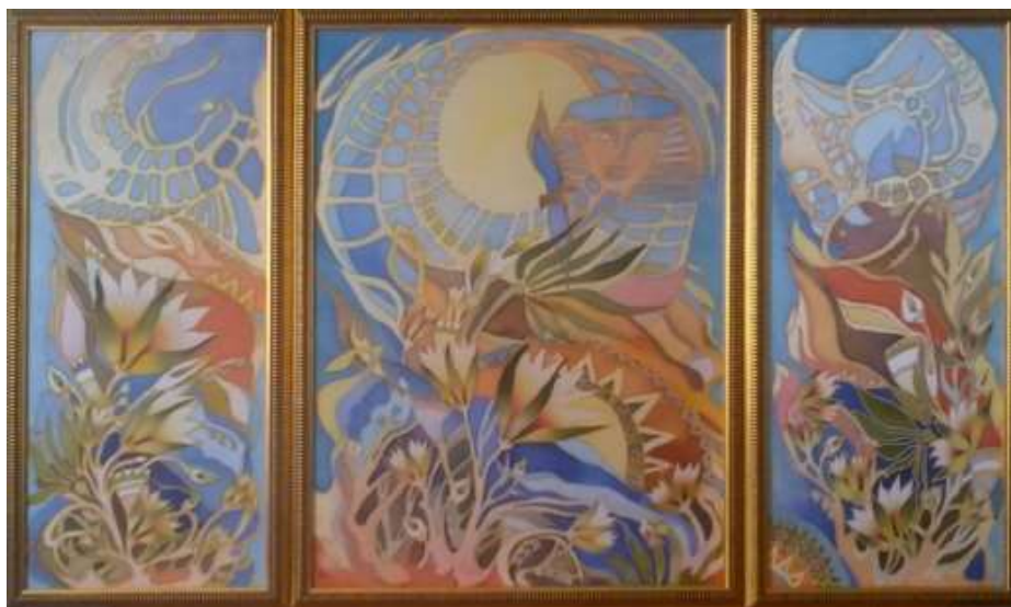
Леонова Г.В. г. Новочеркасск

Свободная роспись – такая техника батика особенно проявляет талант художника, здесь нельзя создать рисунок по готовому шаблону. Создается индивидуальная неповторимость произведения. В основном, свободную роспись практикуют с помощью анилиновых красителей или масляными красками со специальными растворителями.