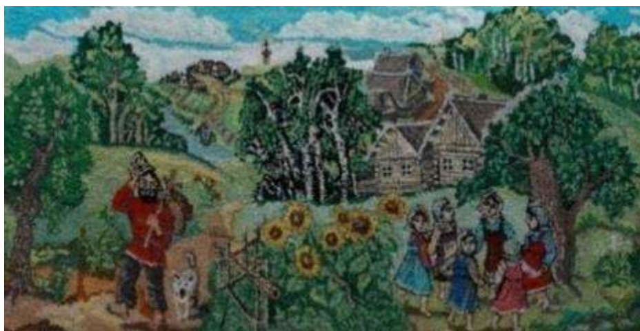
Головань Л.Г. Морозовский район

Ковроделие. По технике выполнения ковры разделяют на паласные и ворсовые. Ковроткачество характерно для центральных русских районов – Воронежской, Белгородской и особенно Курской областей.