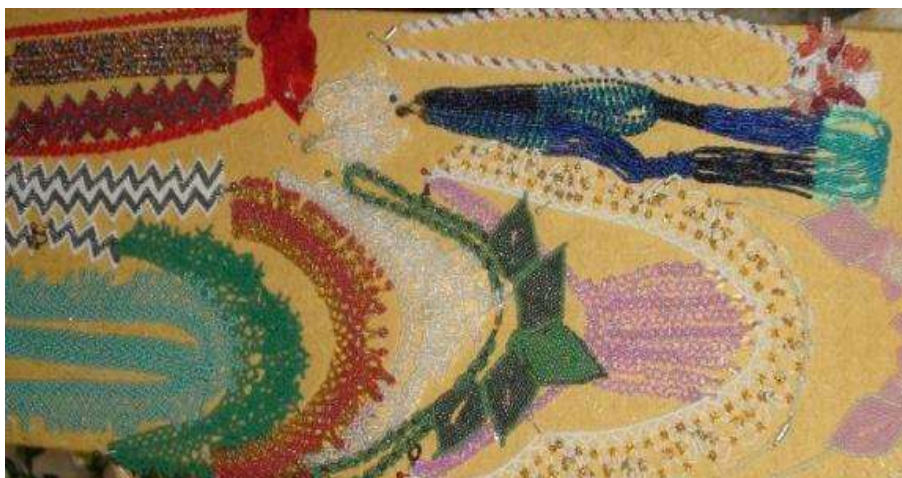
Скороходова Т.Д. Зерноградский район

Мозаичная техника – самый плотный метод плетения. Бисеринки располагаются рядами, смещенными как кирпичная кладка. Это плетение используют для изготовления украшений и аксессуаров – браслетов, коле.