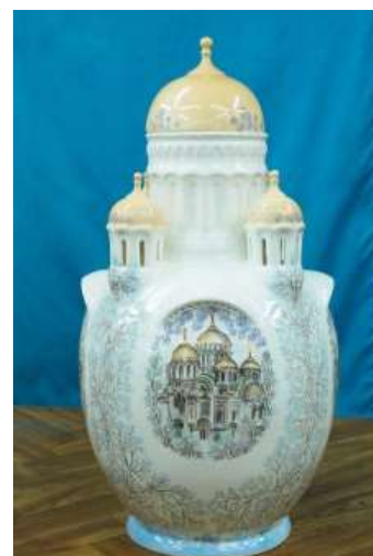
Золотых Л.Л. Семикаракорский район