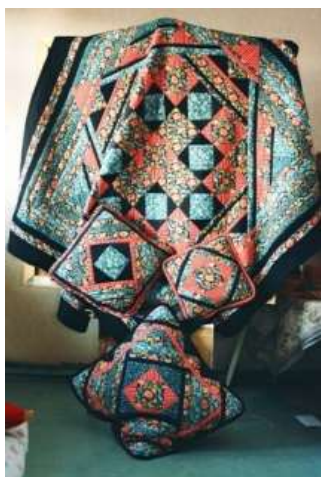
Лоскутное шитьё (печворк) Смородина В.Г. г. Ростов-на-Дону

простегиваются с помощью квилтинговых швов, в результате чего получается декоративное изделие. По выбору рукодельницы квилтинг может быть простым или сложным, его можно выполнять вручную или с помощью швейной машины – в любом случае он дает простор для фантазии и эксперимента. Узоры в этой технике выполняются мелкими стежками «вперед иголку». Разноцветные нитки позволяют подчеркнуть центральный элемент декора и создать удивительные бордюры.