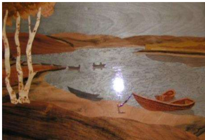
Лазуренко В.П. г. Ростов-на-Дону

«Инкрустация» происходит от латинского слова incrustatio – покрытие слоем чего-либо. Оно употребляется в двух значениях. Во-первых, это техника декорирования изделий путем врезания в поверхность кусочков разнообразных материалов (металла, кости, перламутра), отличающихся от декорируемой поверхности цветом или фактурой. Во-вторых, это самостоятельная область декоративно-прикладного искусства, включающая произведения, созданные в технике инкрустации. При этом врезные элементы и поверхность предмета должны составлять единую плоскость.