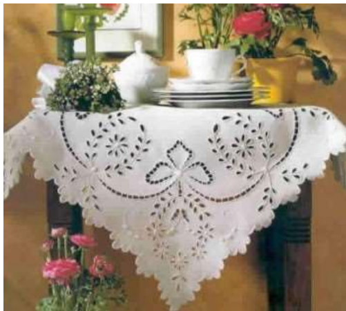
Никифорова Л.И. г. Ростов-на-Дону

Хордовая вышивка – изонить или по-другому изображение нитью, нитяная графика – это создание изображения нитью на твердой основе, бумаге, картоне, CD-дисках.