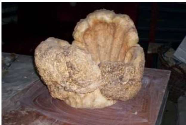
Федотов Г.М. Шолоховский район

Пропильная резьба – вид декоративной обработки древесины, при котором намеченные на плоской поверхности узоры выпиливаются с помощью лобзика или выкрутной пилы. В пропильной резьбе декоративность достигается ажурной сеткой. Пропильная резьба является продолжением плоскорельефной резьбы. Также пропильная резьба является разновидностью прорезной. Основы пропильной резьбы – плоскостной сквозной орнамент. Самый распространенный мотив – S-образный завиток с закрученными концами.