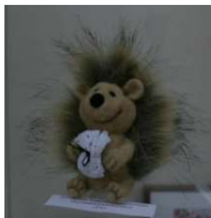
Апольская А.А. Песчанокопский район

Чем плотнее хотите сделать изделие, тем больше раз придется его проткнуть. Эта техника использовалась римлянами как для изготовления теплой водостойкой одежды, так и для нанесения декоративных рисунков на различные тканые поверхности. Сейчас фильцевание широко применяется для нанесения различных рисунков на ткань или же для создания сложных войлочных форм, таких как игрушки.