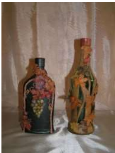
Алымова А.И. г. Ростов-на-Дону

Аппликация в кожевенном деле – наклеивание или пришивание кусочков кож на изделие. В зависимости от того, какое изделие декорируется, несколько различаются способы аппликации. Так, при отделке предметов одежды элементы декора выполняют из тонких кож (опоек, шевро, велюр) и пришивают к основе. При создании панно, изготовлении бутылей или сувениров фрагменты аппликации могут быть выполнены из любых видов кож и наклеены на основу. В отличие от интарсии (см. ниже) при аппликации допустимо соединение элементов «внахлёст».