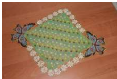
Поддубная Н.Ф. г. Новошахтинск

Плетение «крестиками» (или квадратиками) известно и популярно довольно давно. С помощью него создаются кулоны, колье, пояса и браслеты, бисерные салфетки. Изделия выглядят как густая сетка из крестиков. Этот вид плетения требует достаточно мастерства и терпения.