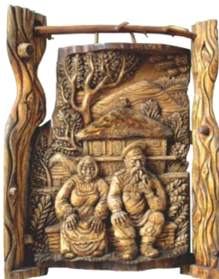
Сухоруков Г.С. г. Шахты

Плосковыемчатая резьба сродни древним петроглифам или даже примитивному рисунку на плотном прибрежном песке, характеризуется тем, что композиции различной сложности вырезаются (вынимаются) особыми приемами и способами из плоскости деревянной заготовки, нетронутые участки которой являются, таким образом, фоном для резьбы. В зависимости от формы выемок и характера рисунка плосковыемчатая резьба может быть геометрической или контурной.