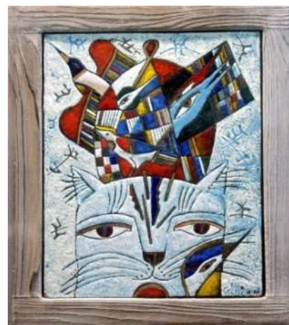
Лиховид Г.В. г. Волгодонск

Горячая эмаль. Техника горячей эмали – это вид ювелирного искусства по золоту, платине, серебру и другим драгоценным материалам. Это, образовавшаяся посредством частичного или полного расплавления стекловидная застывшая масса неорганического, главным образом, окисного состава, иногда с добавками металлов, нанесенная на металлическую основу.