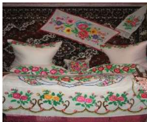
Гепанович В.Н. Боковский район

Вышивка – один из наиболее распространенных видов народного искусства. Орнаментация народной вышивки уходит своими корнями в глубокую древность. В ней сохранились следы того времени, когда люди одухотворяли окружающую природу. Вышивая на одежде и предметах быта изображения солнца, древа жизни, птиц, женской фигуры, они верили, что тем самым принесут в дом благополучие.