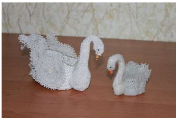
Поддубная Н.Ф. г. Новошахтинск

Объемное плетение появилось сравнительно недавно и активно развивается. С помощью этой техники делают различные жгуты – круглые и квадратные, плотные и ажурные, с включением рубки и стекляруса, объемные кольца, шарики, цветы, снежинки, различные фигурки зверей, бабочек.