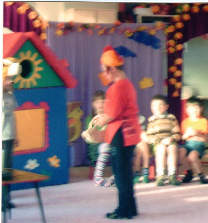
Выходит ребенок в шапочке петуха «Я петух КУ-КА-РЕ-КУ!».