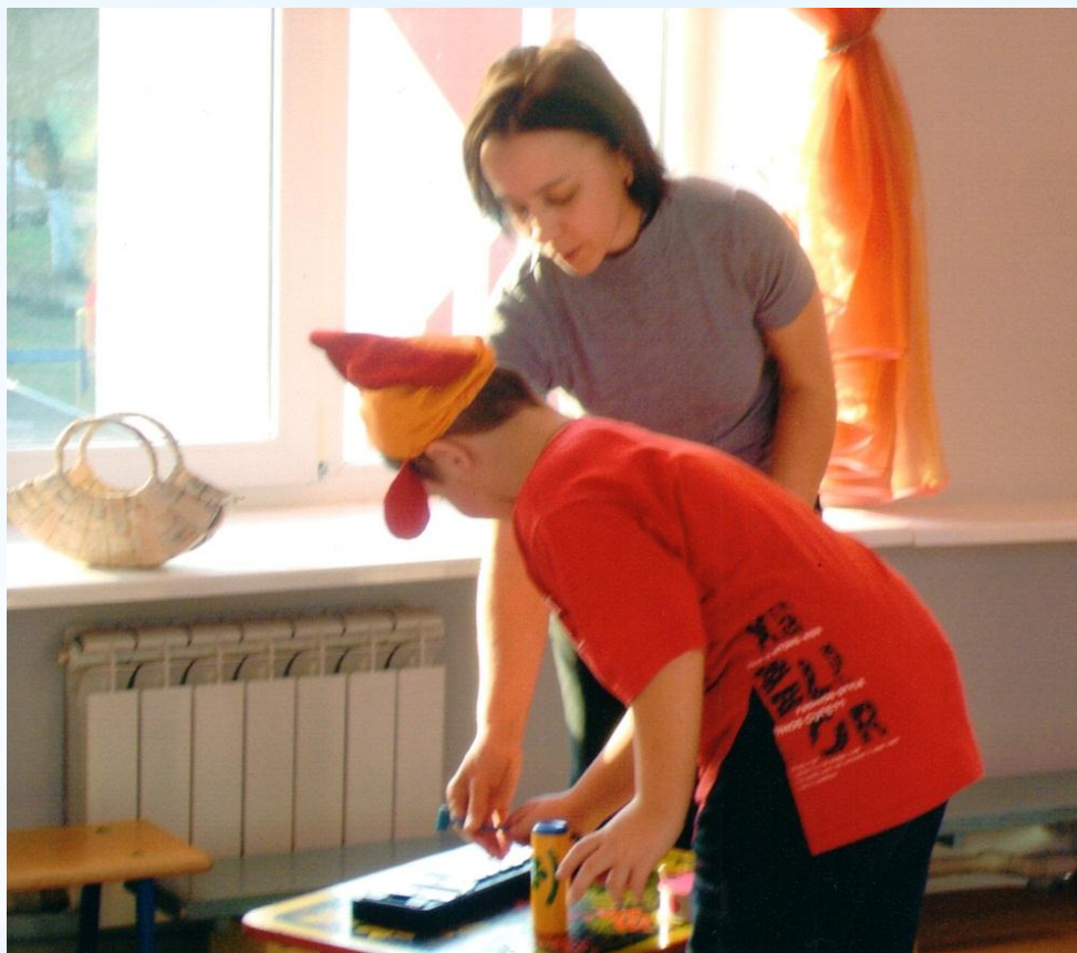
Игра «Угадай что звучит?».