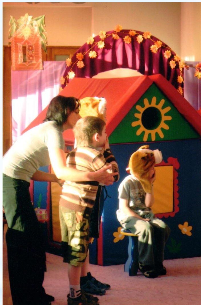
Театрализованная деятельность «Щенок спал в своем домике ...».