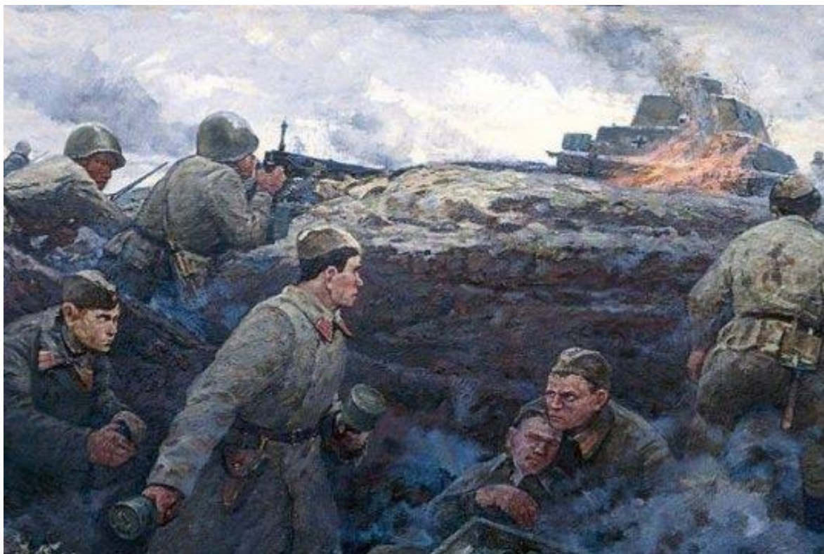
Картина «Подвиг подольских курсантов» Художник И.Г. Краков.

На позиции, занимаемой курсантами, шли артиллерийские обстрелы, авиационные налеты и танковые атаки. Советская молодёжь стояла насмерть, выдерживая артиллерийские и авиационные удары.