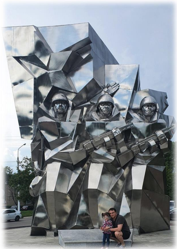
Памятник Подольским курсантам в г.Подольске

В память о подвиге «Подольских курсантов», наших с вами земляков называют улицы, школы, возводят монументы, сочиняют стихи и песни, и снимают фильмы.