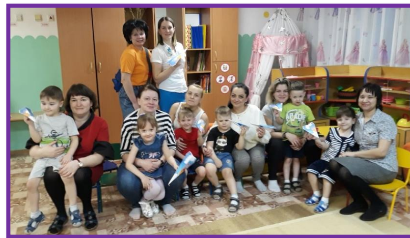
Ребята вместе с мамами и Карлсоном сделали бумажные самолеты и отправились в полет