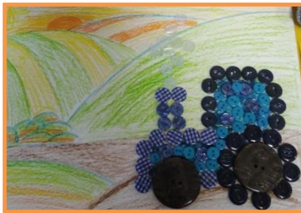
Ростик с мамой сделали картину «Сбор урожая»