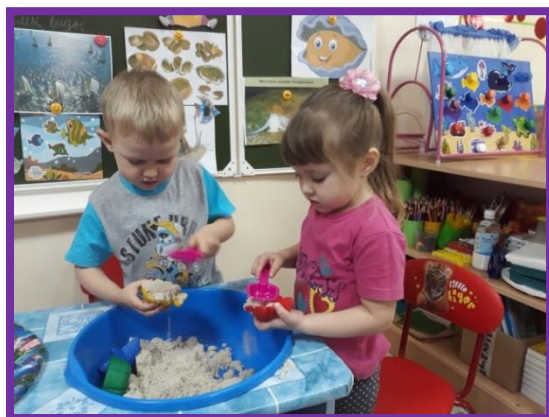
Играем в «Морские секреты»