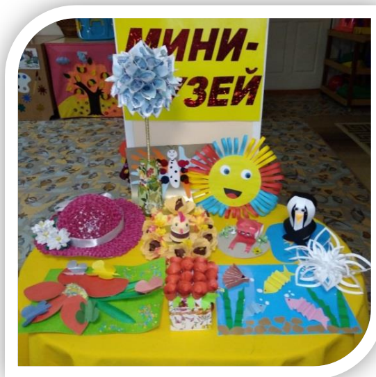
«Бумажные фантазии» детей и их родителей