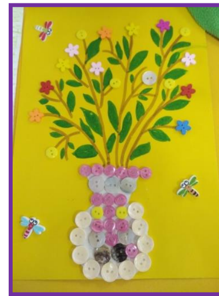
Тася с мамой сделали вазу с цветами