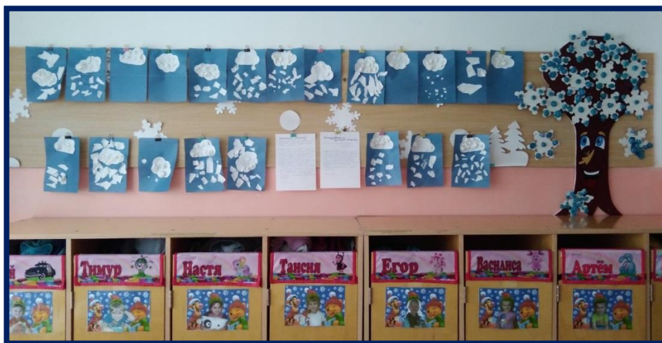
Бумажная история «Как облака стали тучами, и пошёл снег»