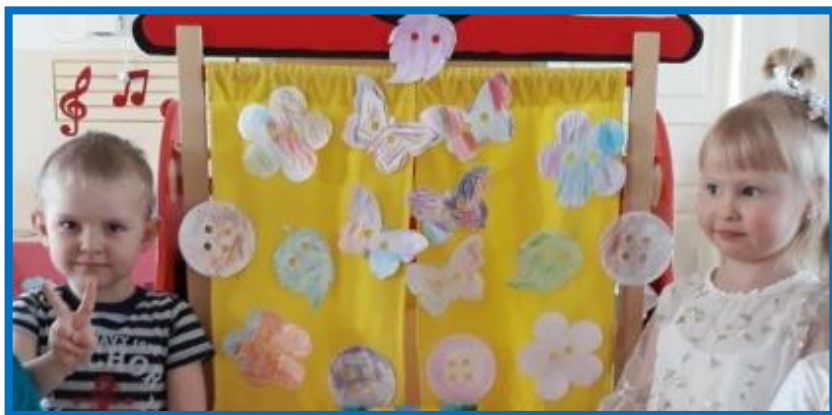
Вот такие красочные пуговицы получились у ребят