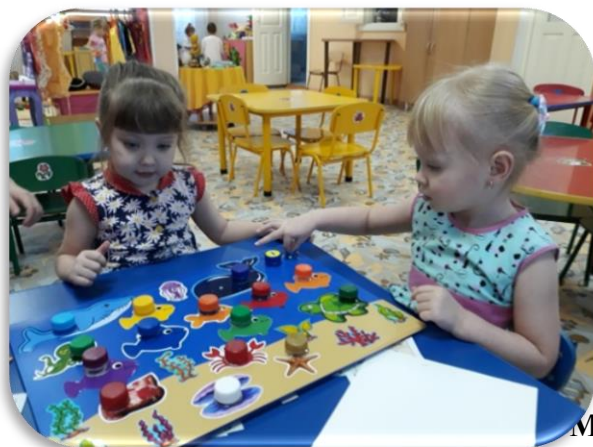
«Игровая заниматика» в подводном мире»