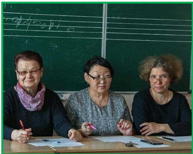
Жюри конкурса выразительного чтения