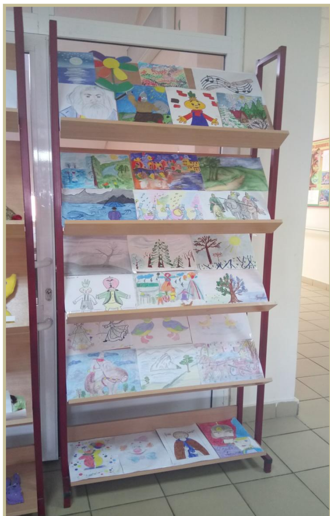
Выставка рисунков «Музыка глазами детей»