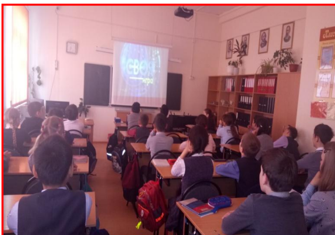
Урок в игровой форме «Своя игра» 5 кл.