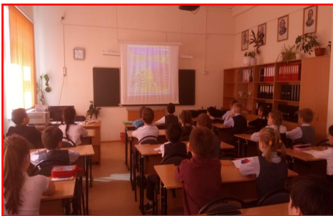
Игра «Угадай мелодию» 2 класс