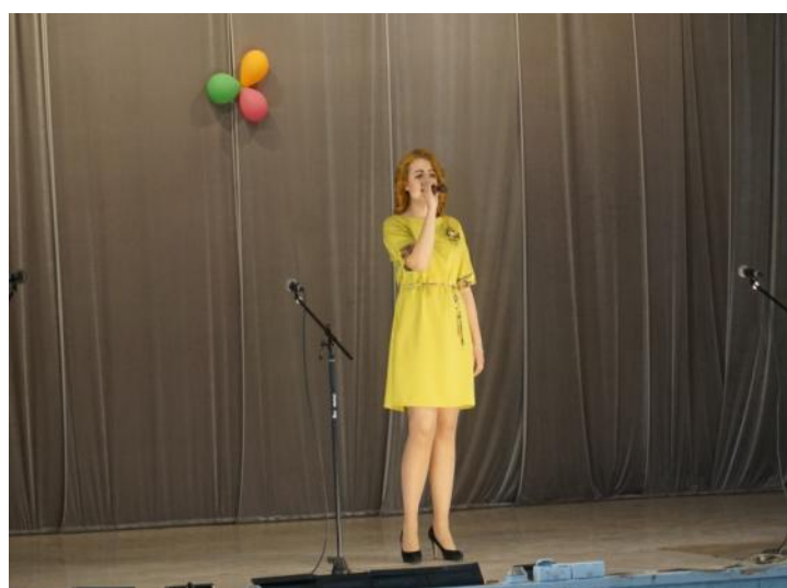
Солисты вокально-хорового коллектива «Гармония