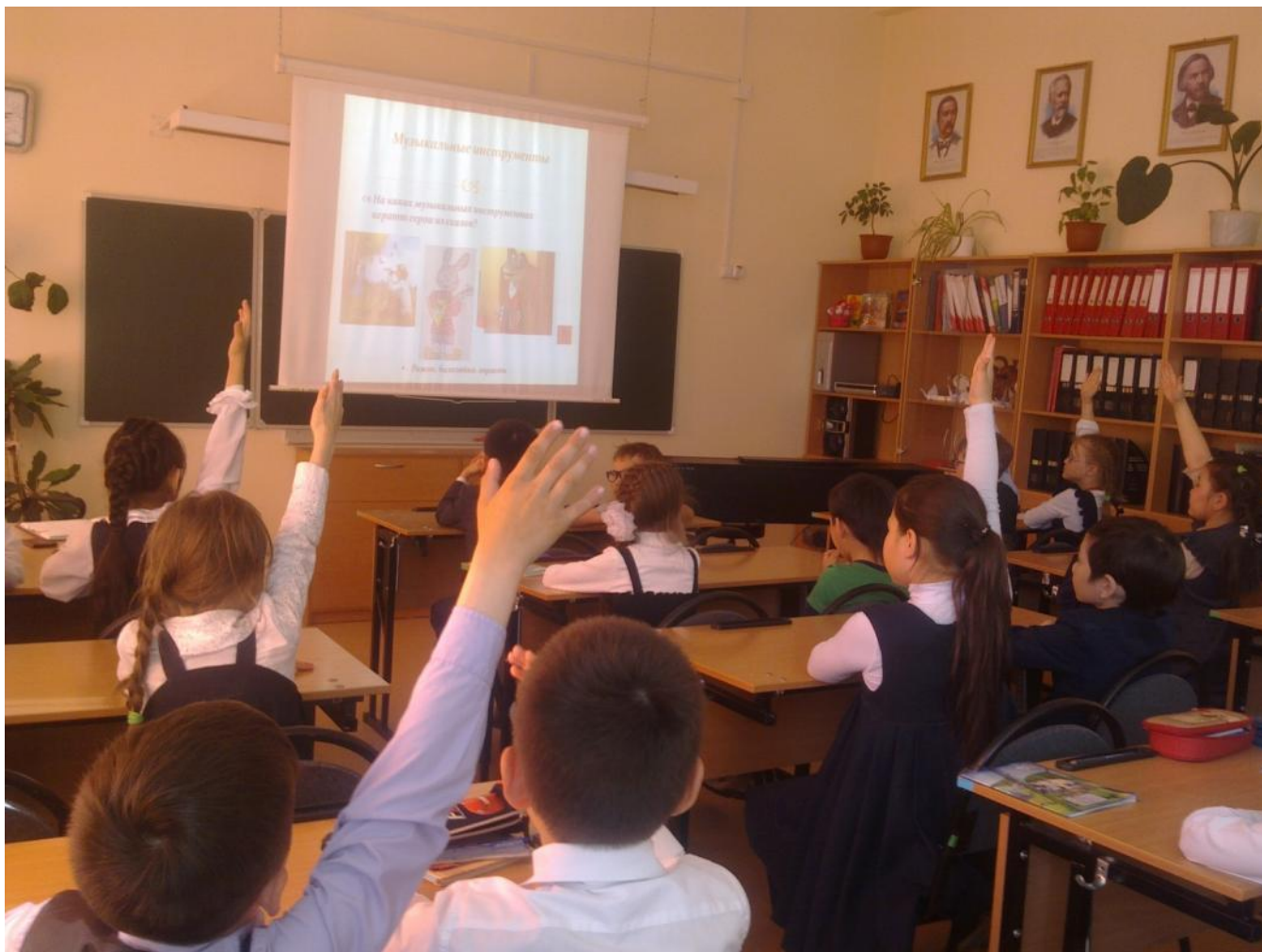
2 класс, «Своя игра»