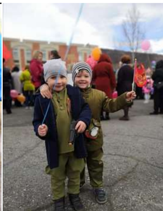
Празднование «Дня Победы» на площади