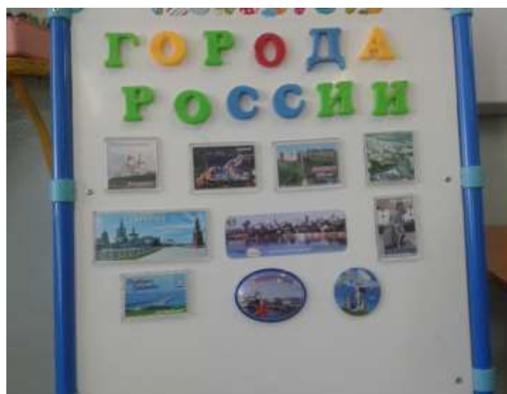
Стенд «Моя малая Родина – Юктали».