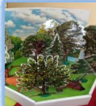
Модель из картона «Лес»