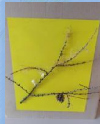
Заготовки для альбома гербария