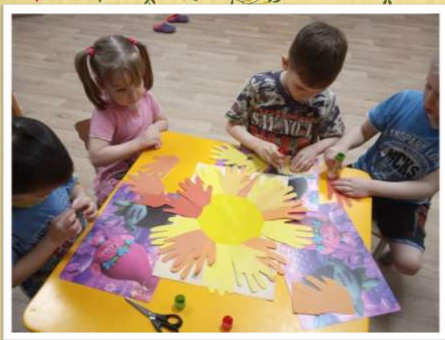
Изготовление поделки «Мама-солнышко мое»