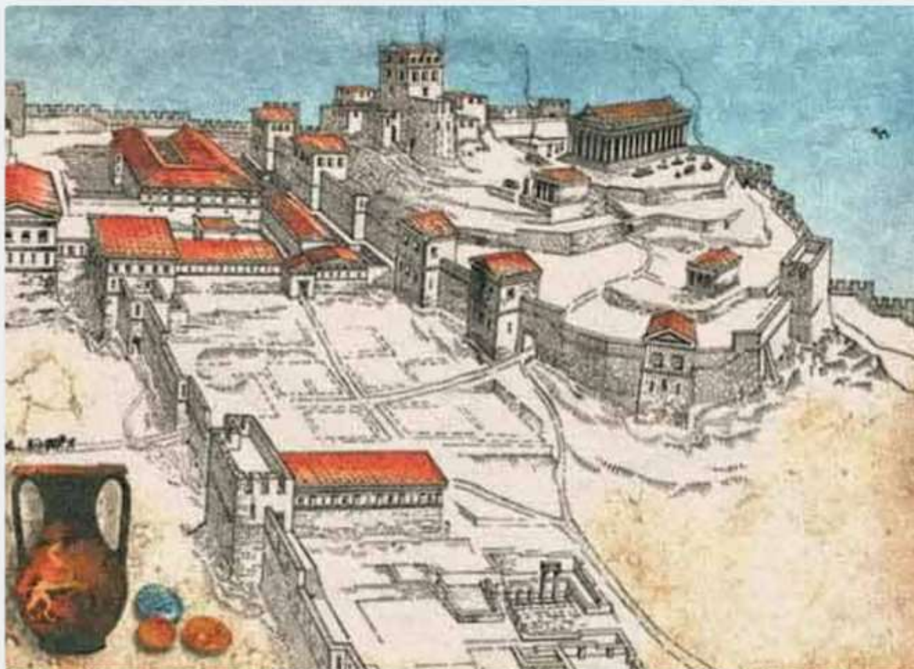
Античный Пантикапей в Керчи