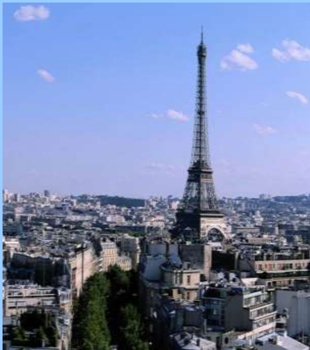
Лютеций (от древнего названия Парижа)