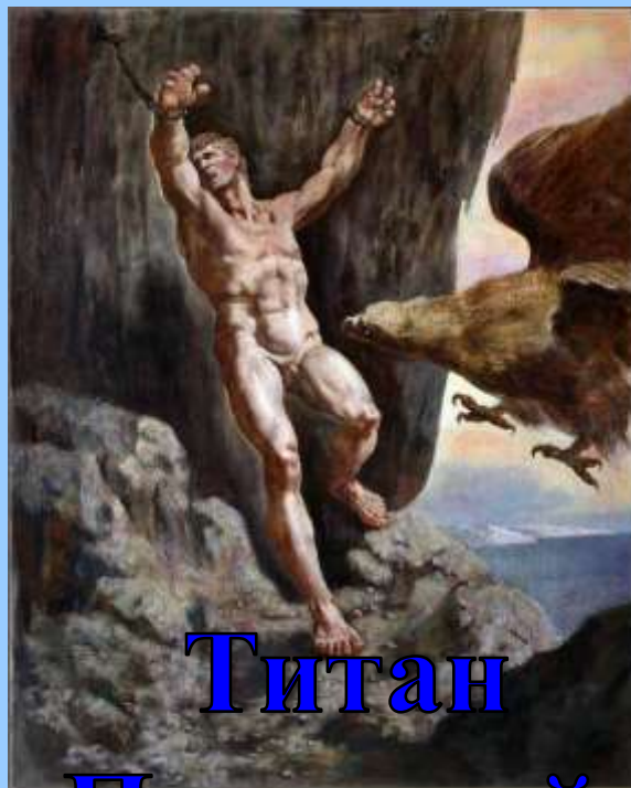
Титан Прометий, Тантал – по именам героев греческой мифологии