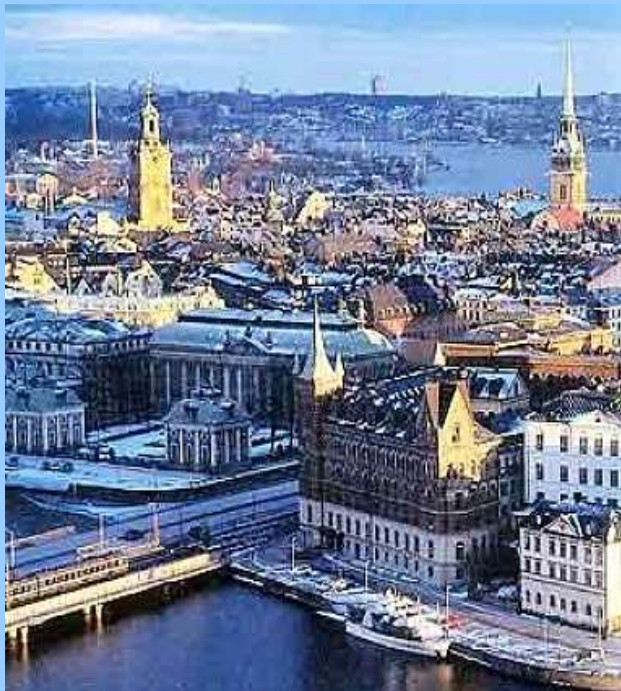
Гольмий (от лат. названия Стокгольма)