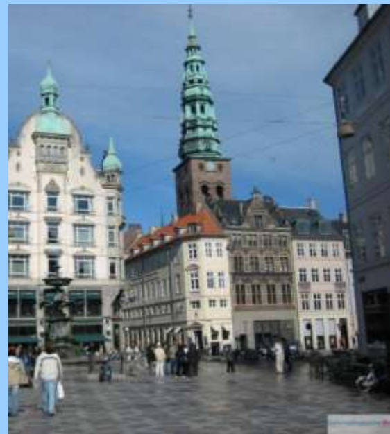
Гафний (от древнего названия Копенгагина)