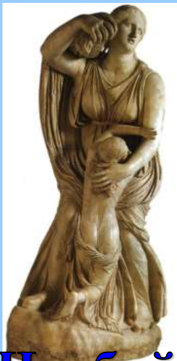
Ниобий – по имени Ниобеи – дочери Тантала

Какие элементы названы в честь героев древней мифологии?