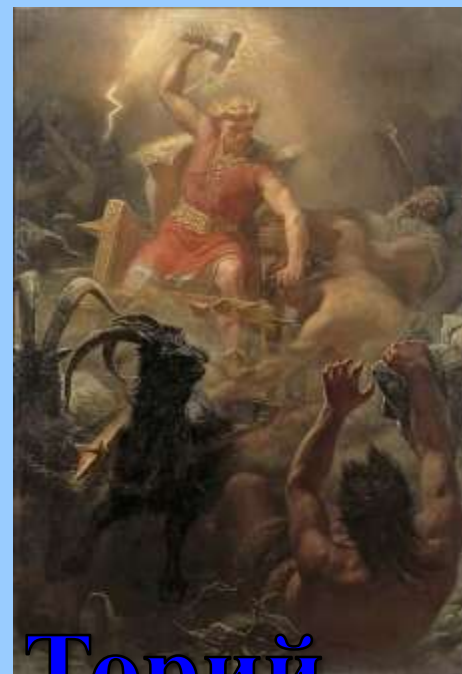
Торий – по имени божества скандинавской мифологии Тора