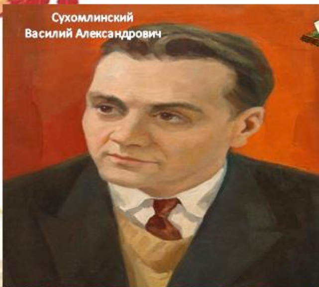
Сухомлинский Василий Александрович

В своей работе я использую опыт великих педагогов