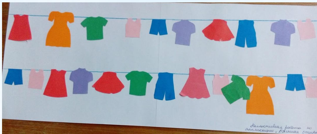
Коллективная аппликация «Большая стирка»