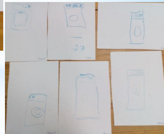
Рисование «Стиральная машина нашей семьи», «Любимая одежда»