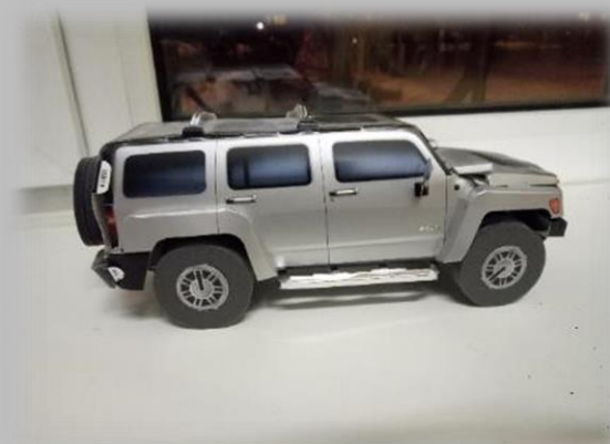
Транспорт, изготовленный из бросового материала и картона.