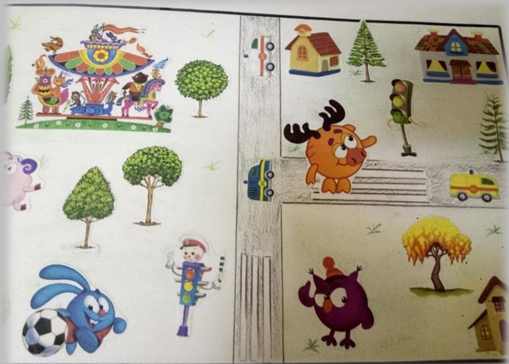
Аппликация с элементами рисования. (коллективная работа)