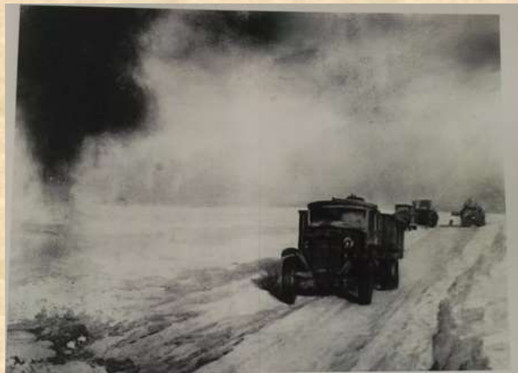
ФАШИСТСКИЕ ЗАХВАТЧИКИ БОМБЕЖКАМИ С ВОЗДУХА И АРТИЛЛЕРИЙСКИМИ ОБСТРЕЛАМИ ПЫТАЛИСЬ СОРВАТЬ СНАБЖЕНИЕ ЛЕНИНГРАДА