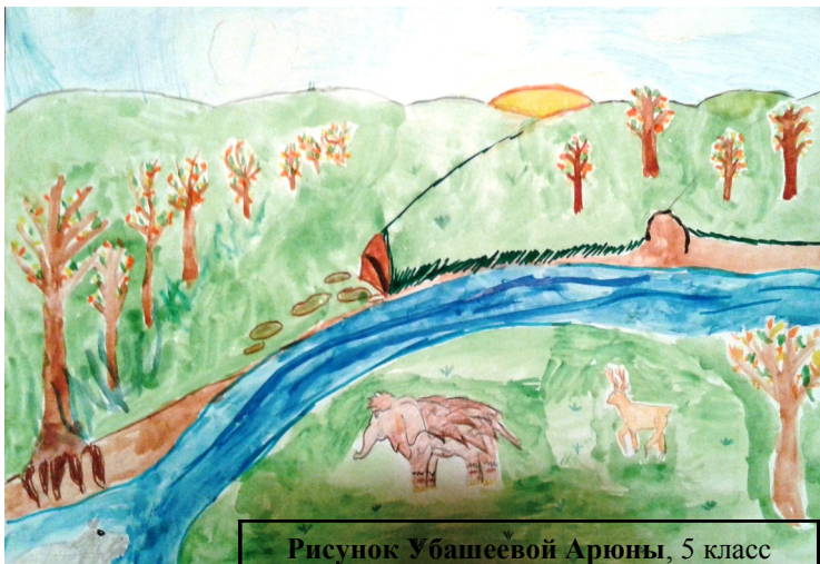
Рисунок Убашеевой Арюны, 5 класс

В дни засушливого солнцестояния эти деревья перенесли огненную жару и превратились в засохшие коряги. Другим стало страшно от длинных корявых теней деревьев, им показалось, что какой-то неведомый зверь потянулся своими крюками в их сторону. Они увеличили ход и скоро стали бежать. Но тут откуда – то ни возьмись прилетел попугай.