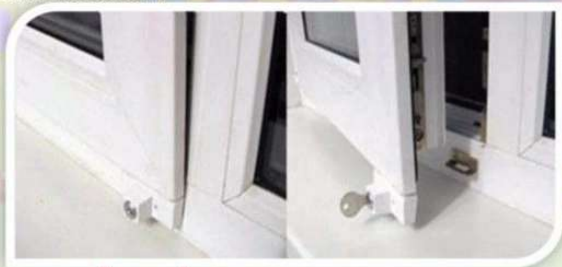
Замок блокировщик с ключом

Можно воспользоваться специальными замками блокираторами, которые предлагают установщики пластиковых окон.