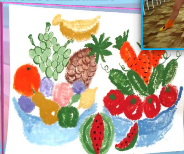
Коллективная работа «Полезное питание»