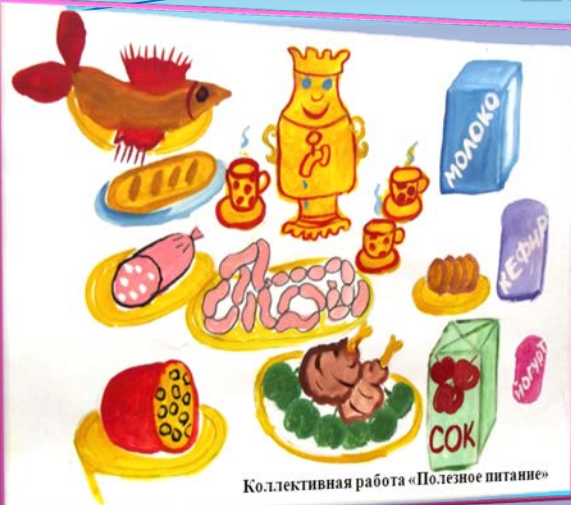
Коллективная работа «Полезное питание»