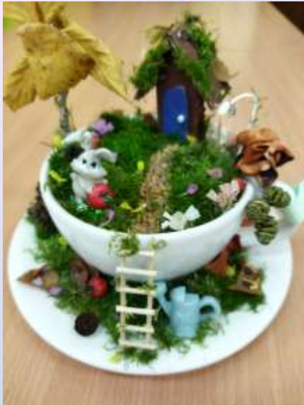
Яковлев Рома «Зайчик»