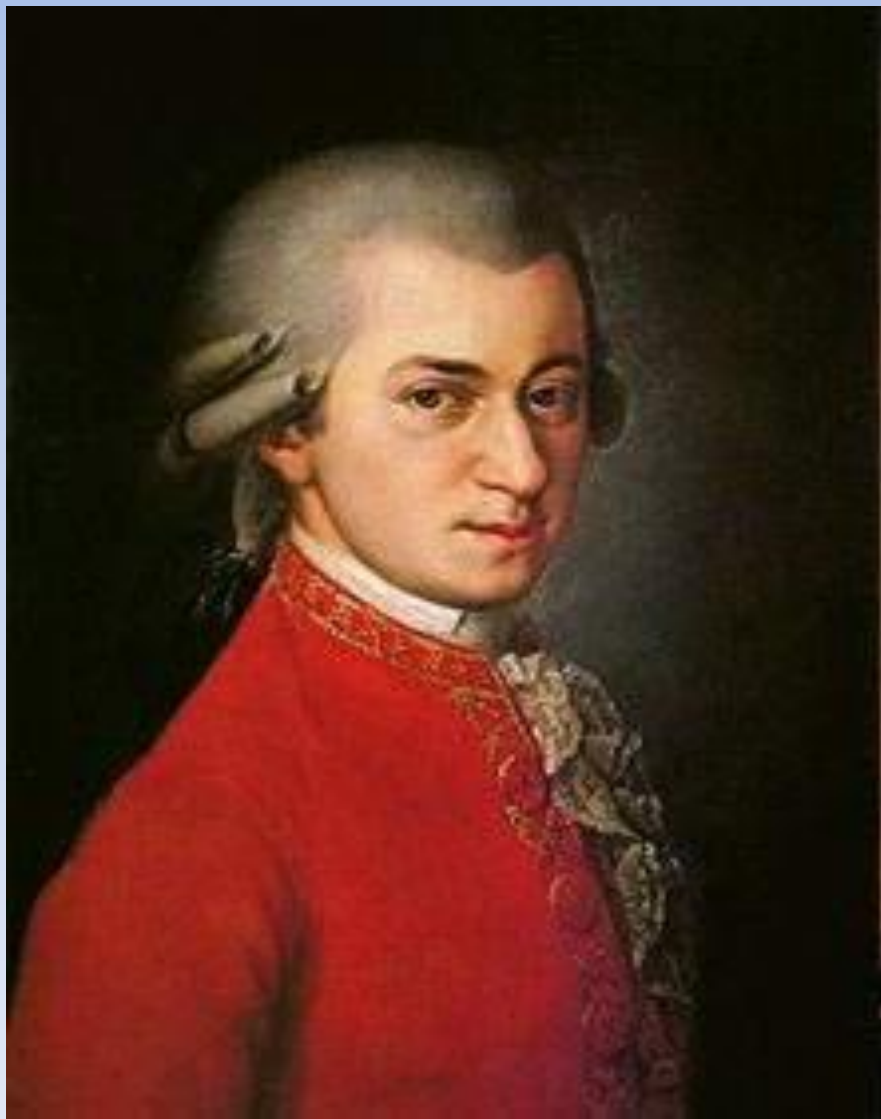
Вольфганг Амадей Моцарт «Лакримоза» из «Реквиема»