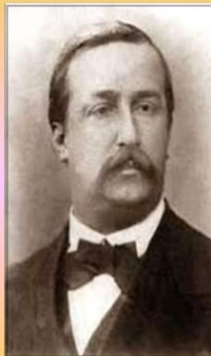
Александр Порфирьевич Бородин (1833-1887)