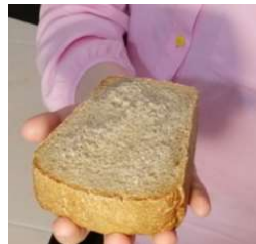
Март 2022 года

Состав блокадного хлеба: злаковая мука, жмых, трава, отруби, древесная стружка.