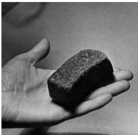
Декабрь 1941 года