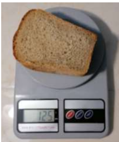
125 грамм хлеба на целый день