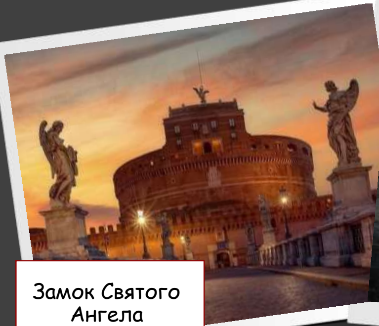
Замок Святого Ангела