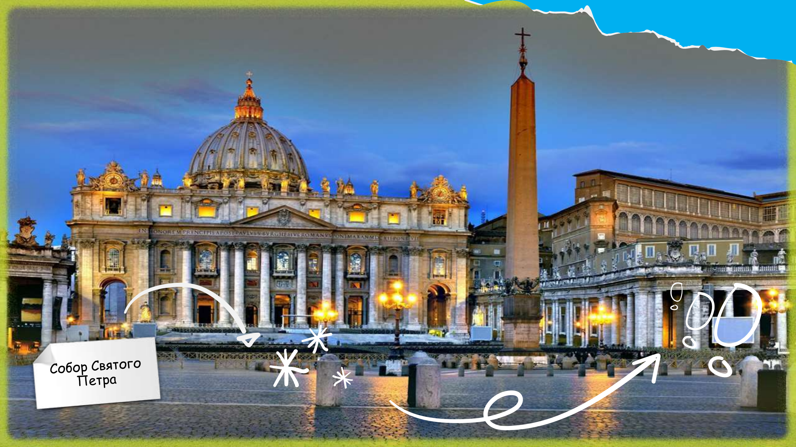
Собор Святого Петра