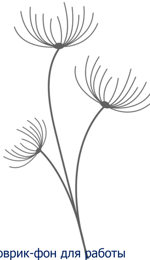
Коврик-фон для работы