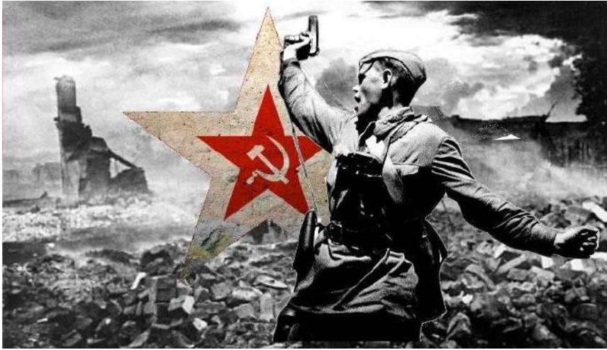
Великая Отечественная Война