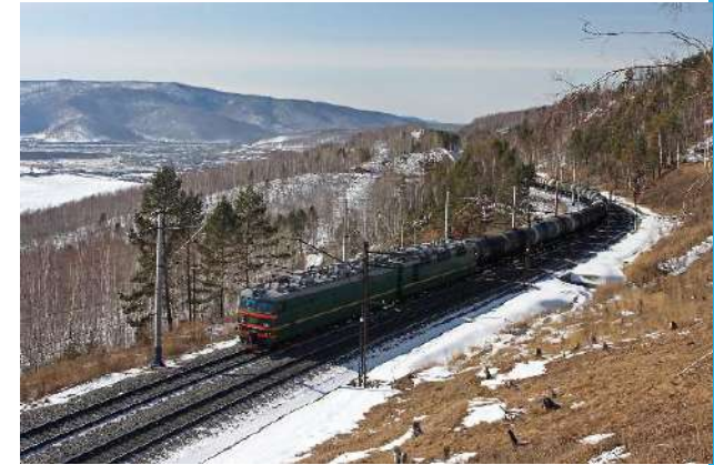
железная дорога бам