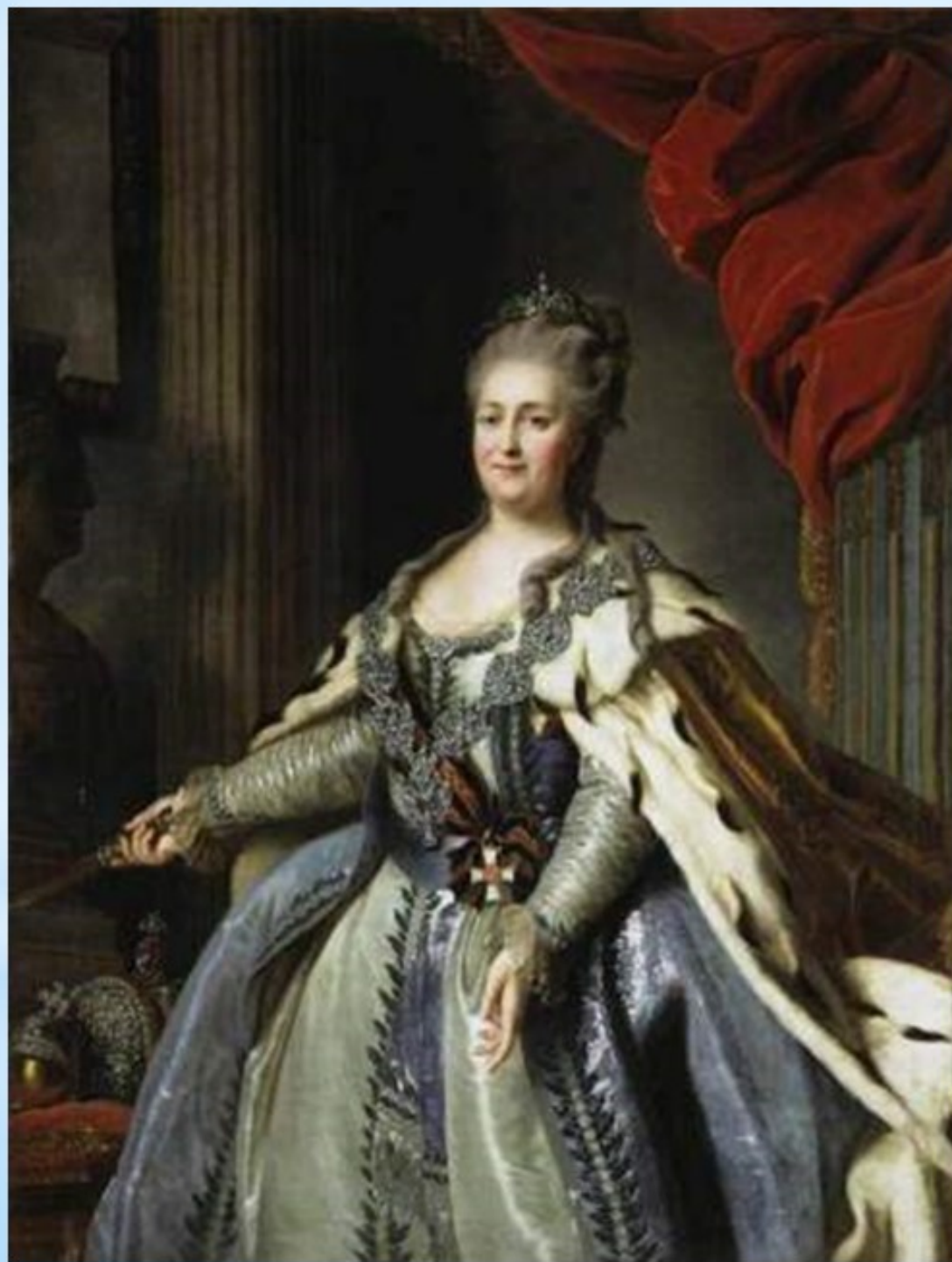
Екатерина II с орденом Святого Великомученика и Победоносца Георгия