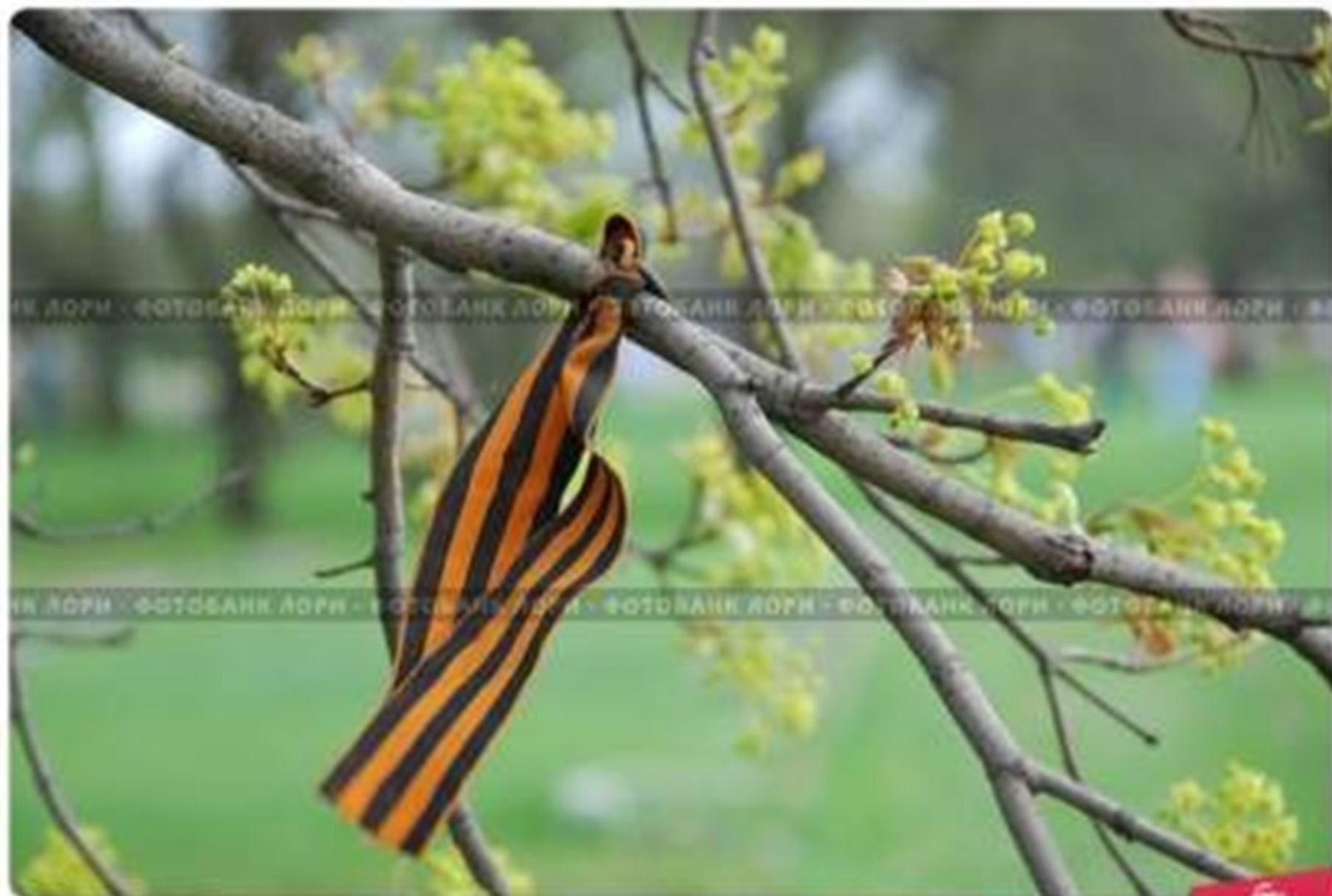
Георгиевская лента на дереве, развевающаяся на ветру. На Пискаревском в День