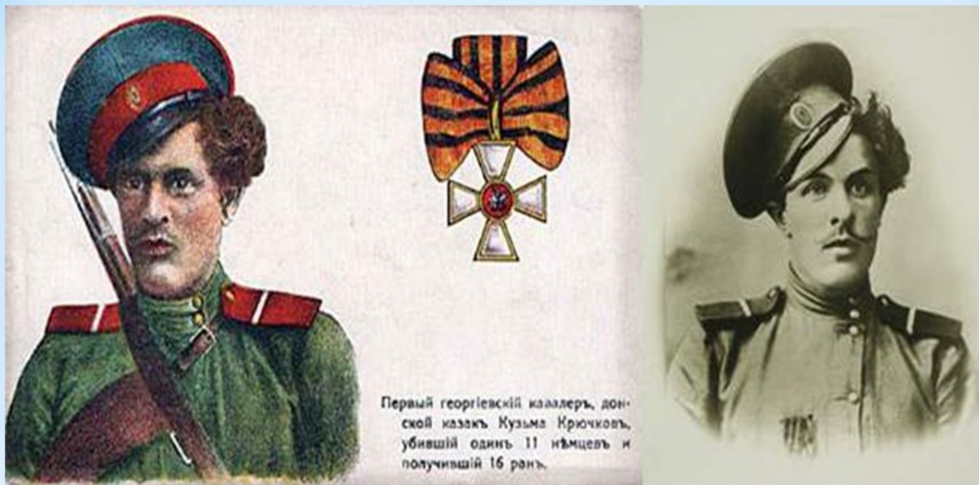
Первый георгиевский кавалер, донской казак Кузьма Крючков, убивший один 11 немцев и получивший 16 рань.

Первый георгиевский кавалер, донской казак Кузьма Крючков, убивший один 11 немцев и получивший 16 ран, во время Первой Мировой войны (1914-1918гг.)