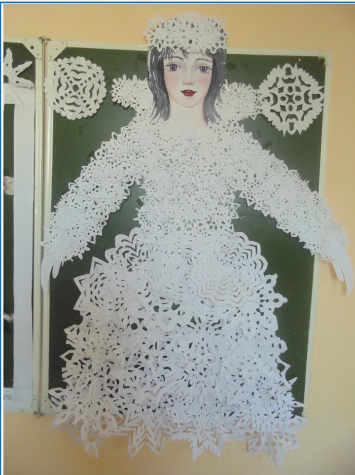
Платье для зимы изготовлено из снежинок.