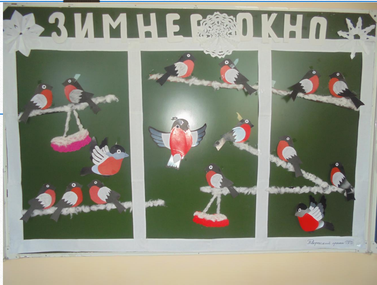
Снегири были посажены на веточки рябины.